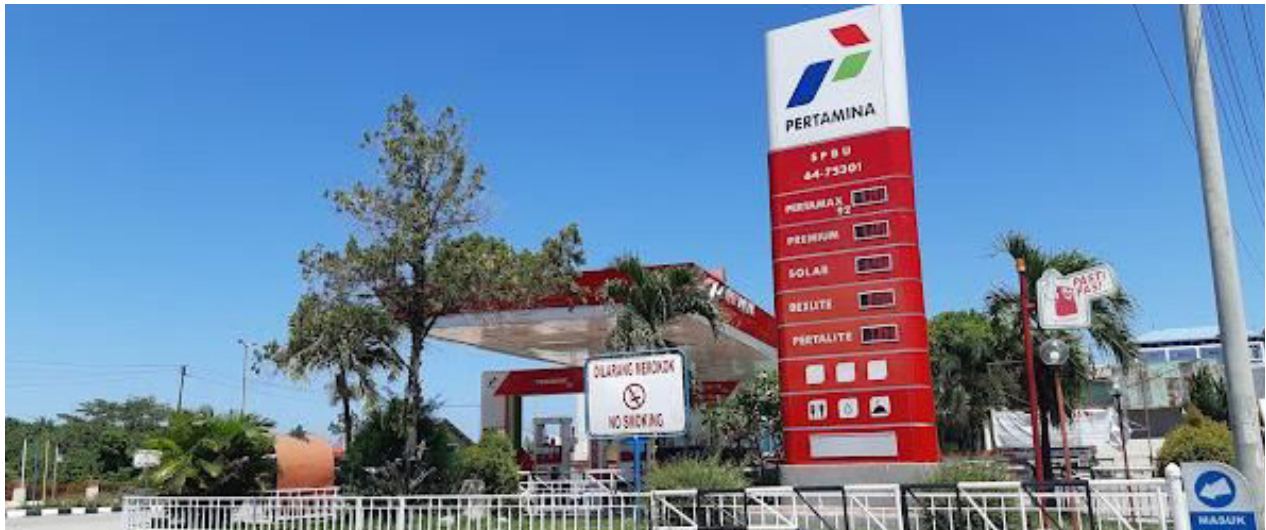
Ilustrasi SPBU di Bontang.