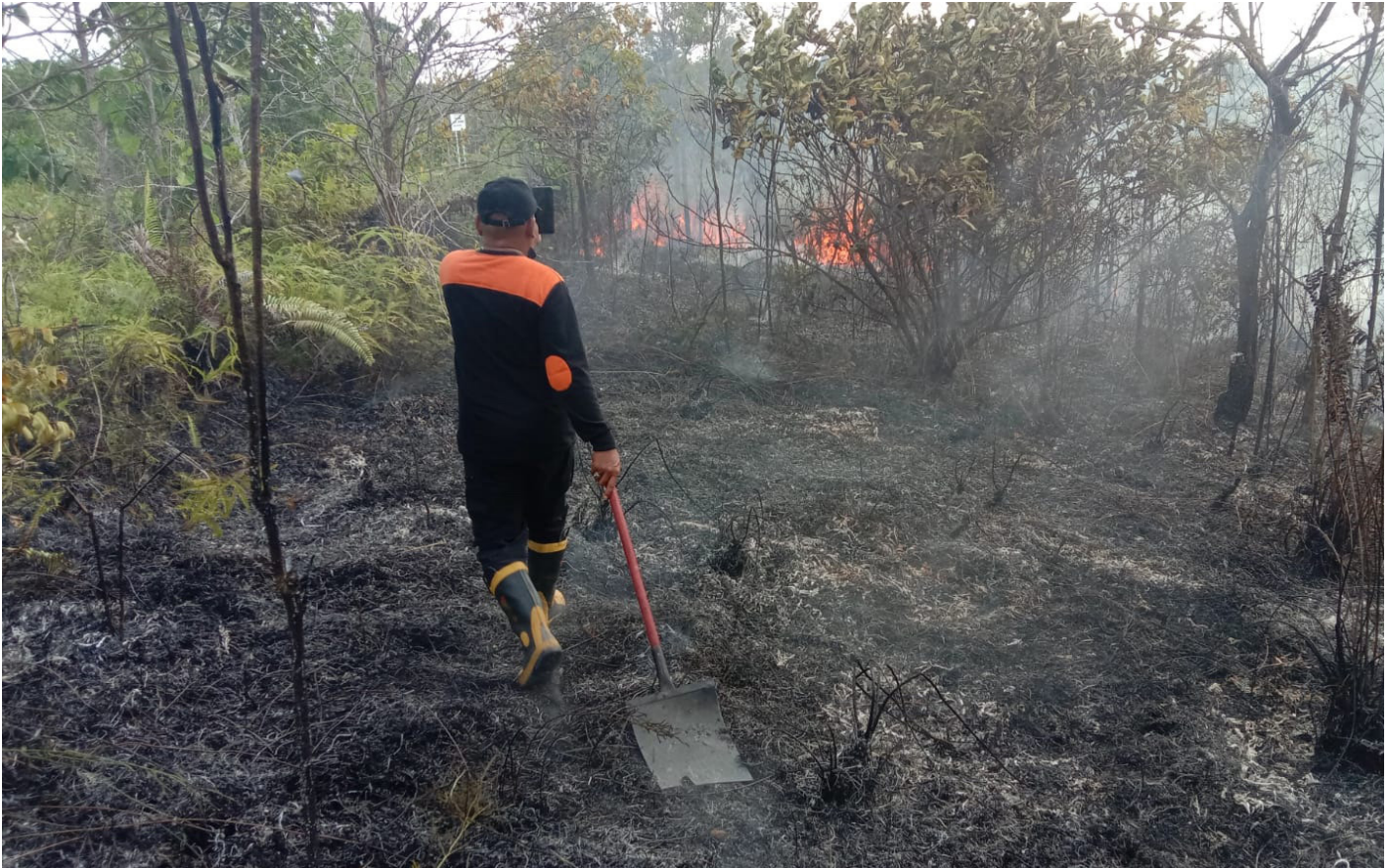
Kebakaran hutan dan lahan (Karhutla) di Balikpapan.