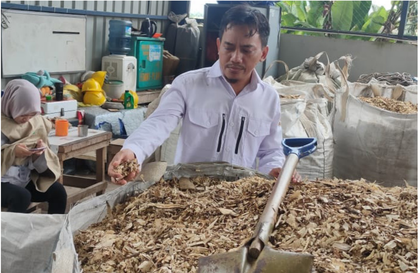
BBJP dan Woodchip yang diproduksi TPAS Manggar untuk bahan baku Co-Firing.