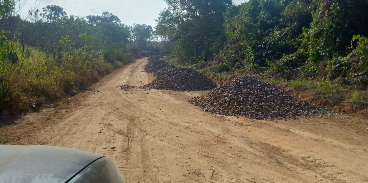
Salah satu akses jalan penghubung Batu Engau-Tanjung Harapan