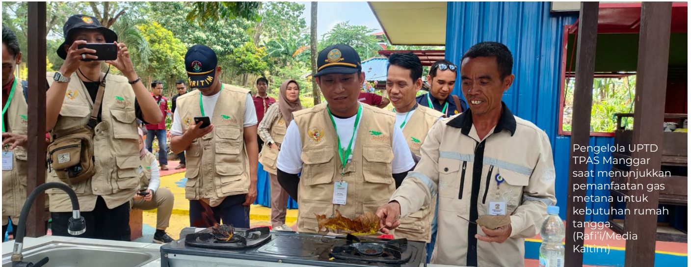
Pengelola UPTD TPAS Manggar saat menunjukkan pemanfaatan gas metana untuk kebutuhan rumah tangga.