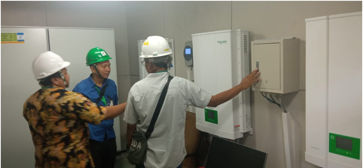
Salah satu inverter yang berada PLTS Atap yang berada di PT PHM.