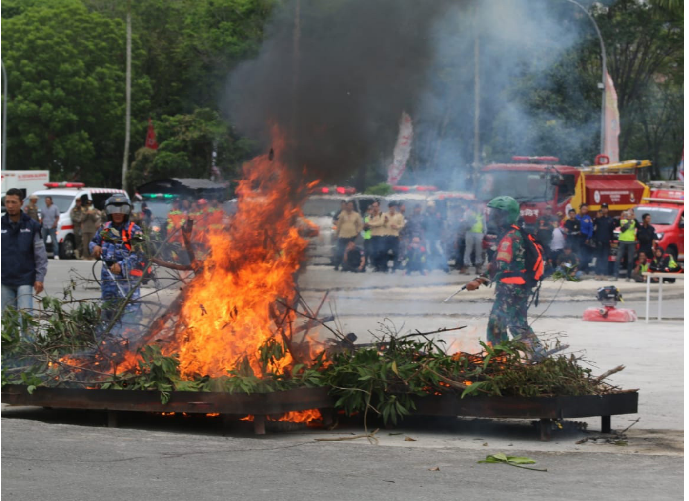
Simulasi Kesiapsiagaan Bencana Kebakaran Hutan dan Lahan (Karhutla) di Balikpapan Sport Convention Center (BSCC) Dome Balikpapan pada Kamis (7/9/2023).