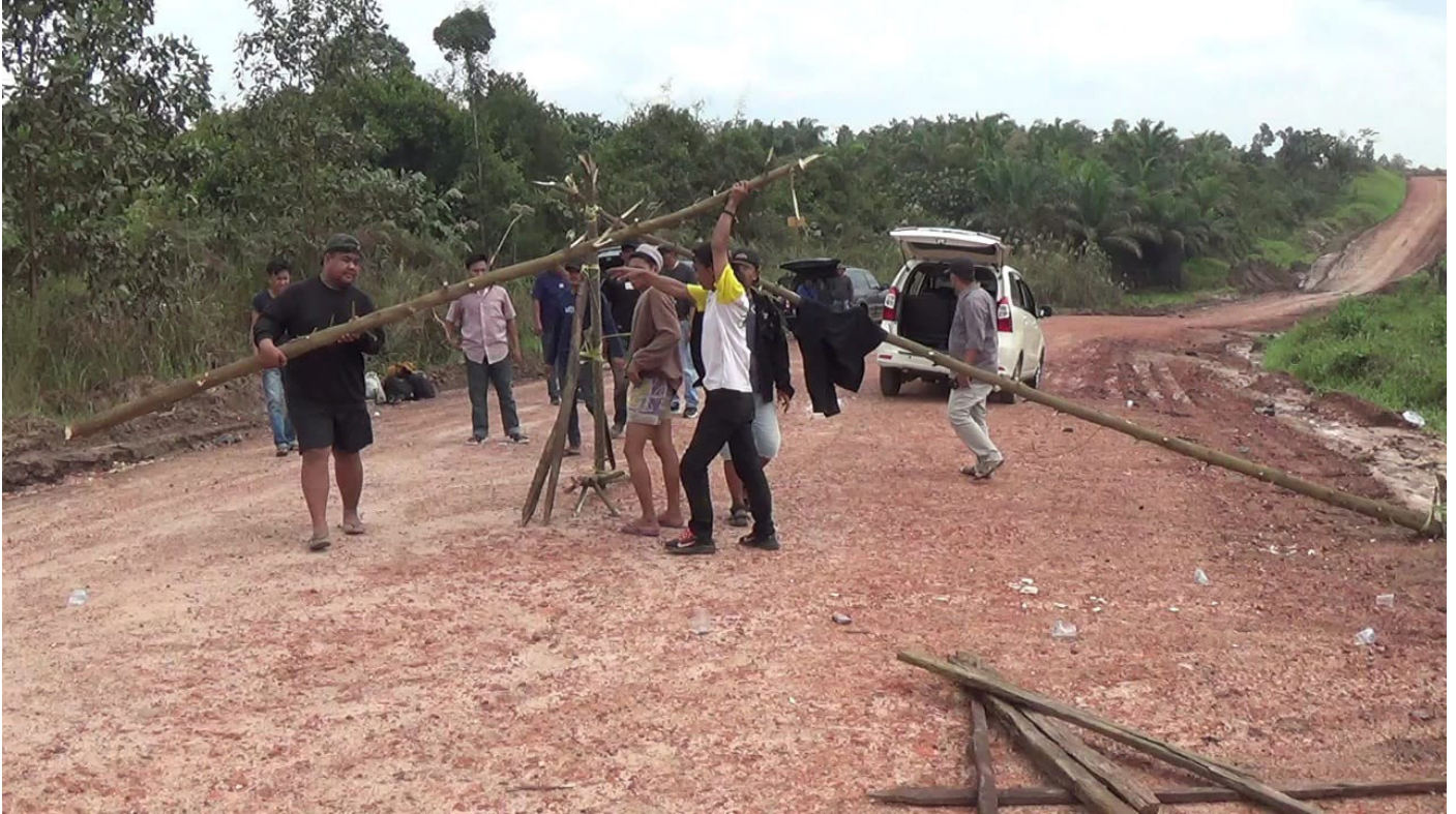
Warga Desa Batuah, Kukar, Menutup Jalan yang Sering Dilalui Kendaraan Batu Bara dan Galian C Ilegal