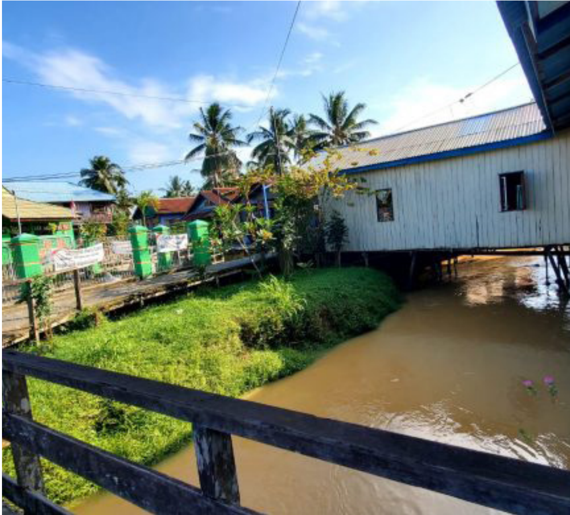
Penurapan Sungai Guntung mulai menemukan titik terang.