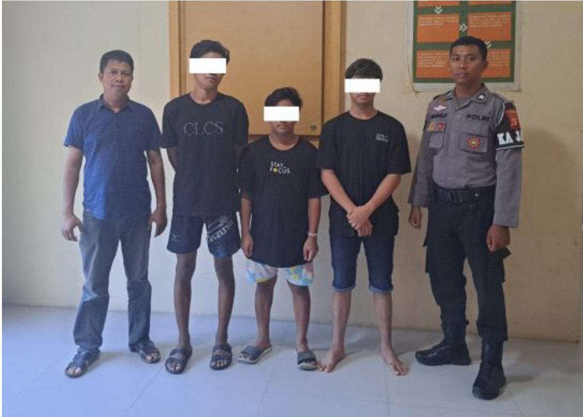
Tiga pelaku pengeroyokan saat ditahan di Polsek Bontang Selatan.