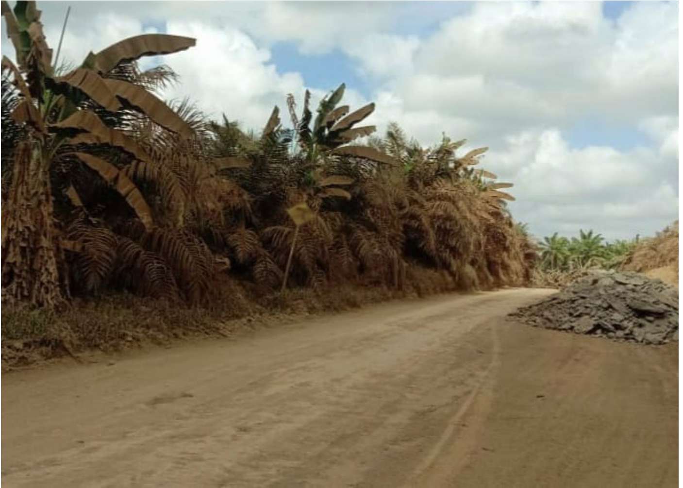
Pelepah kelapa sawit yang diselimuti debu akibat lintasan truk pengangkut batu bara