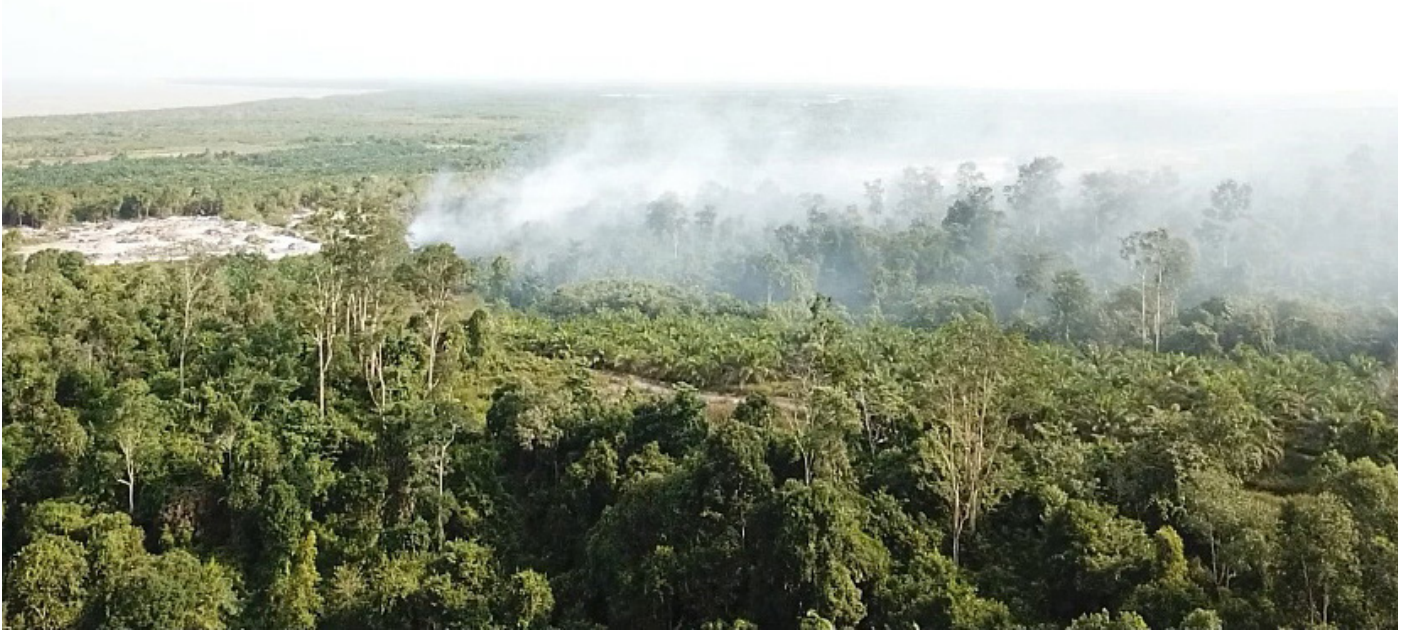
Foto tangkapan udara kebakaran hutan dan lahan (karhutla) di Babulu Laut.