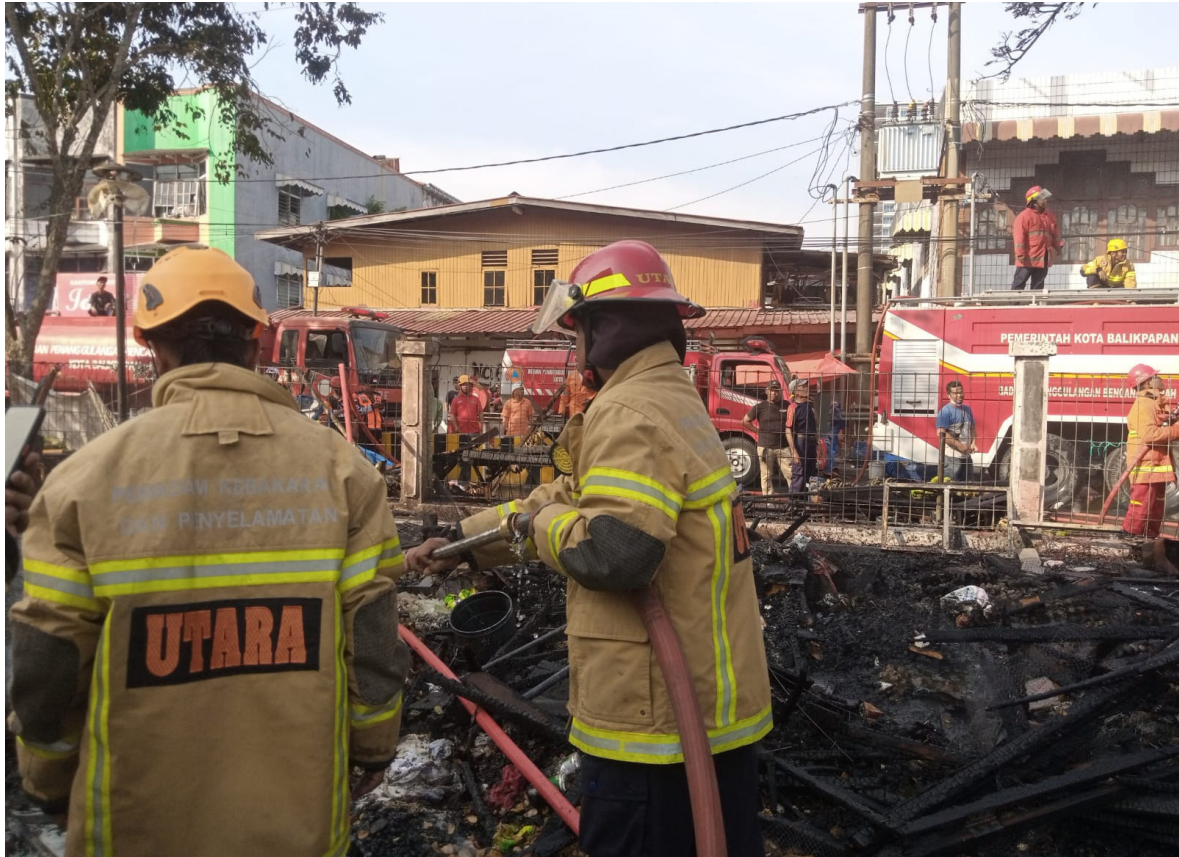
Lapak di Pasar Pandan Sari yang Terbakar pada Minggu (3/9).