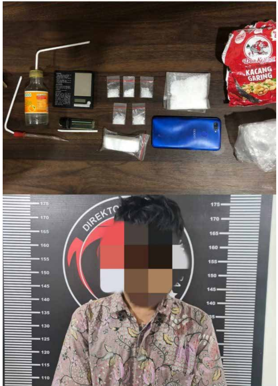
Pelaku RH (34) bersama sejumlah barang bukti sabu-sabu seberat 42,32 gram yang diamankan Polres Kukar.

Diketahui, pelaku sudah diincar oleh Satreskoba Polres Kukar dalam setahun terakhir. Dari pen-