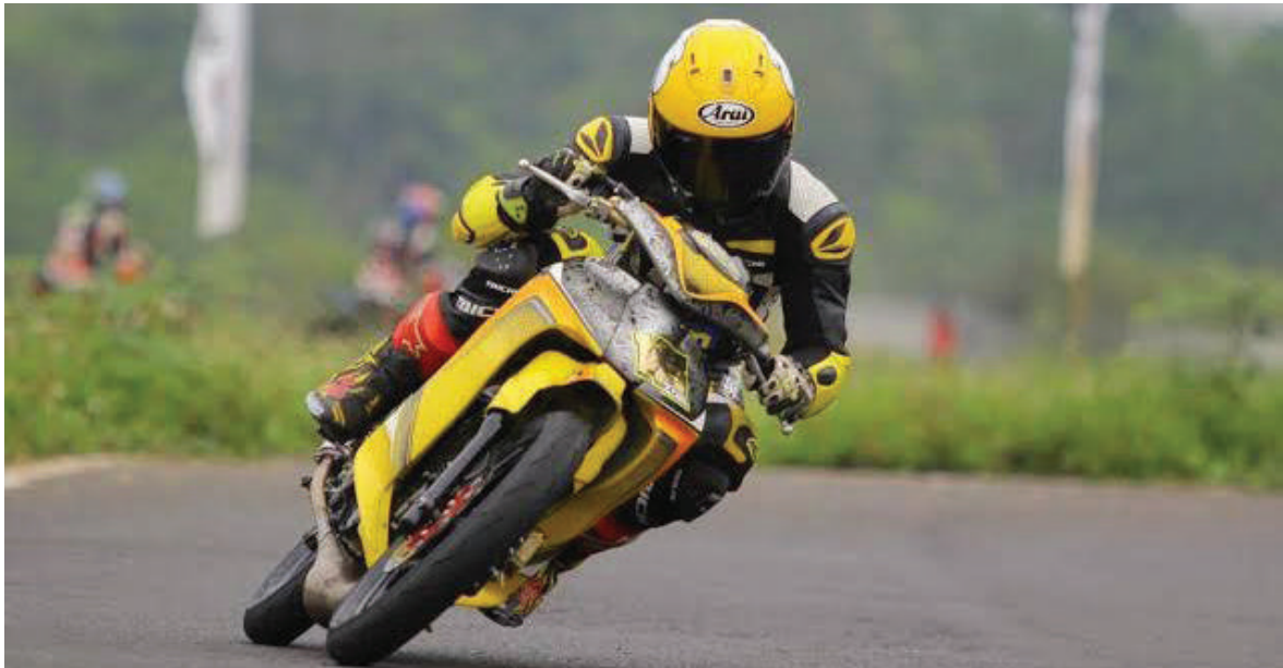
Pebalap asal Paser