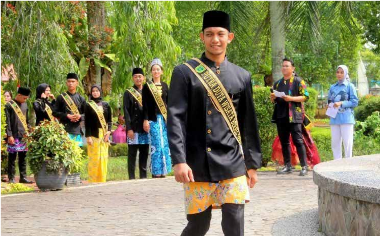
Peragaan busana batik Berau yang dibawakan oleh Putra Putri Duta Wisata Berau 2023 di Taman Cendana, Tanjung Redeb, beberapa waktu lalu.