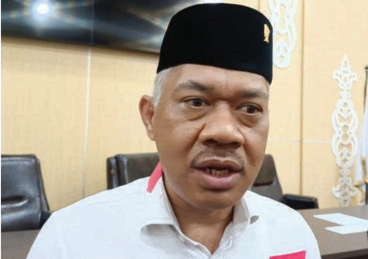
Wakil Ketua DPRD Kota Balikpapan, Budiono.