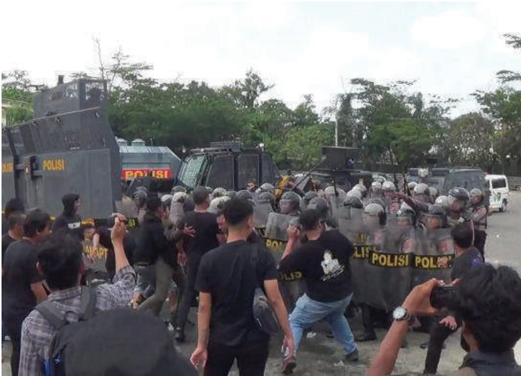
Pelaksanaan Simulasi Sispam Kota di halaman BSCC Dome Balikpapan pada Senin (2/10).