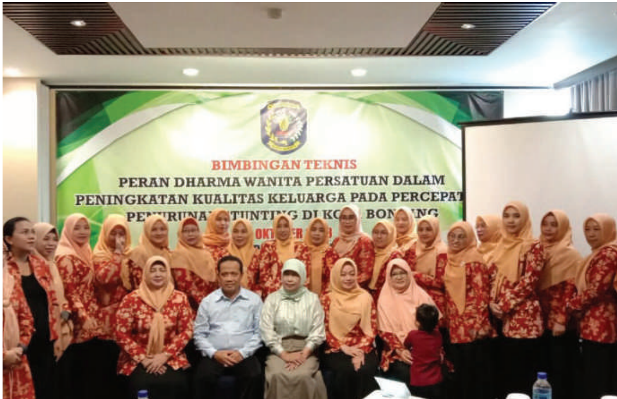
Bimtek penurunan stunting DWP Bontang di Balikpapan.