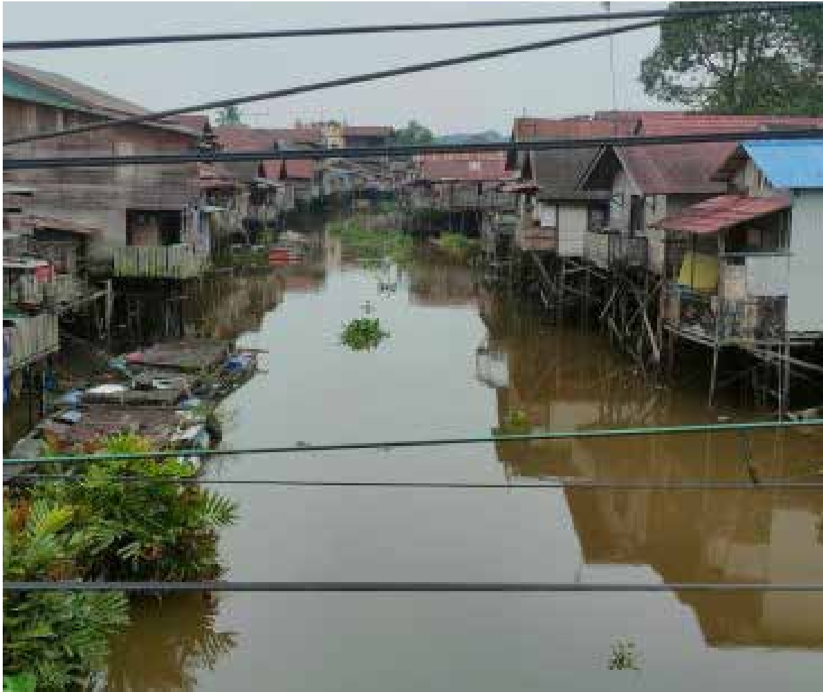
Anak Sungai Mahakam yang terletak di wilayah Kelurahan Loa Ipuh.