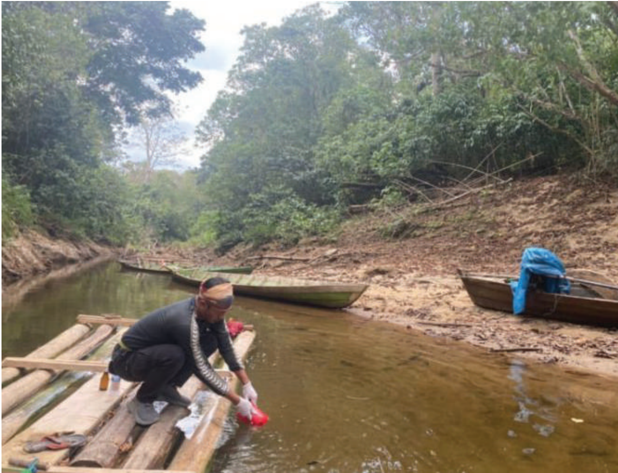
Petugas mengambil sampel air sungai