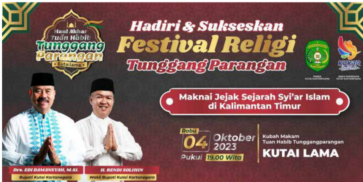
Banner pelaksanaan Haul Akbar Habib Tunggang Parangan Kutai Lama.