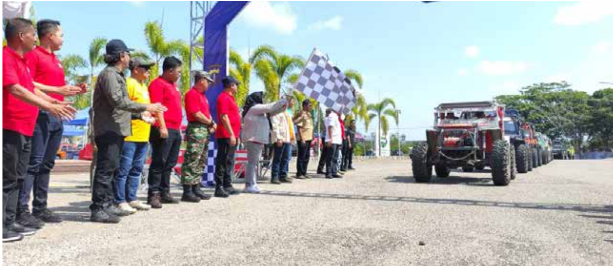
Pelepasan Peserta Off-Road