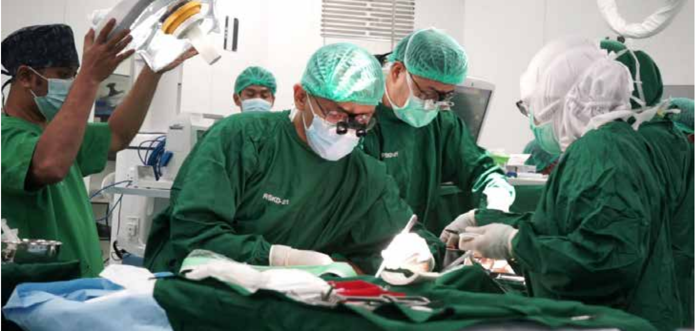
Proses operasi jantung terbuka yang dilakukan tim jantung RSKD pada Jumat (29/9).