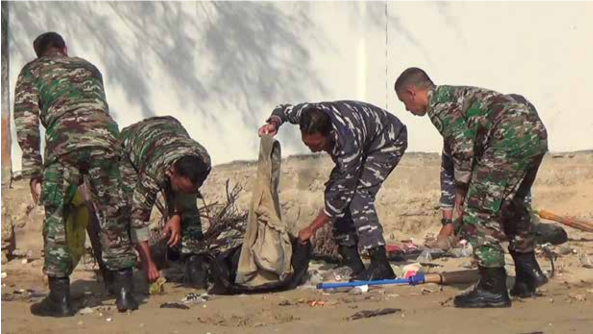
Gabungan personel TNI saat melakukan aksi bersih-bersih pantai Manggar, Balikpapan Timur pada Jumat (29/9).