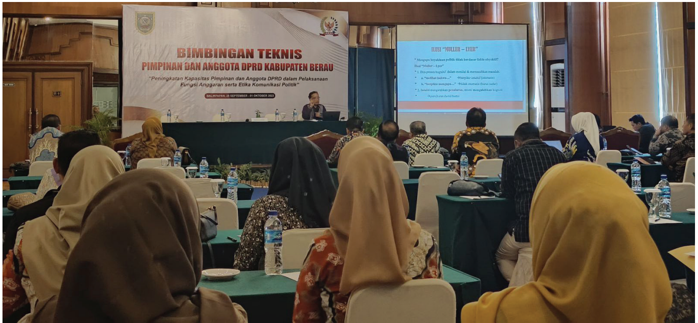
Suasana Workshop dan Bimtek Pelaksanaan Anggaran dan Etika Komunikasi Politik