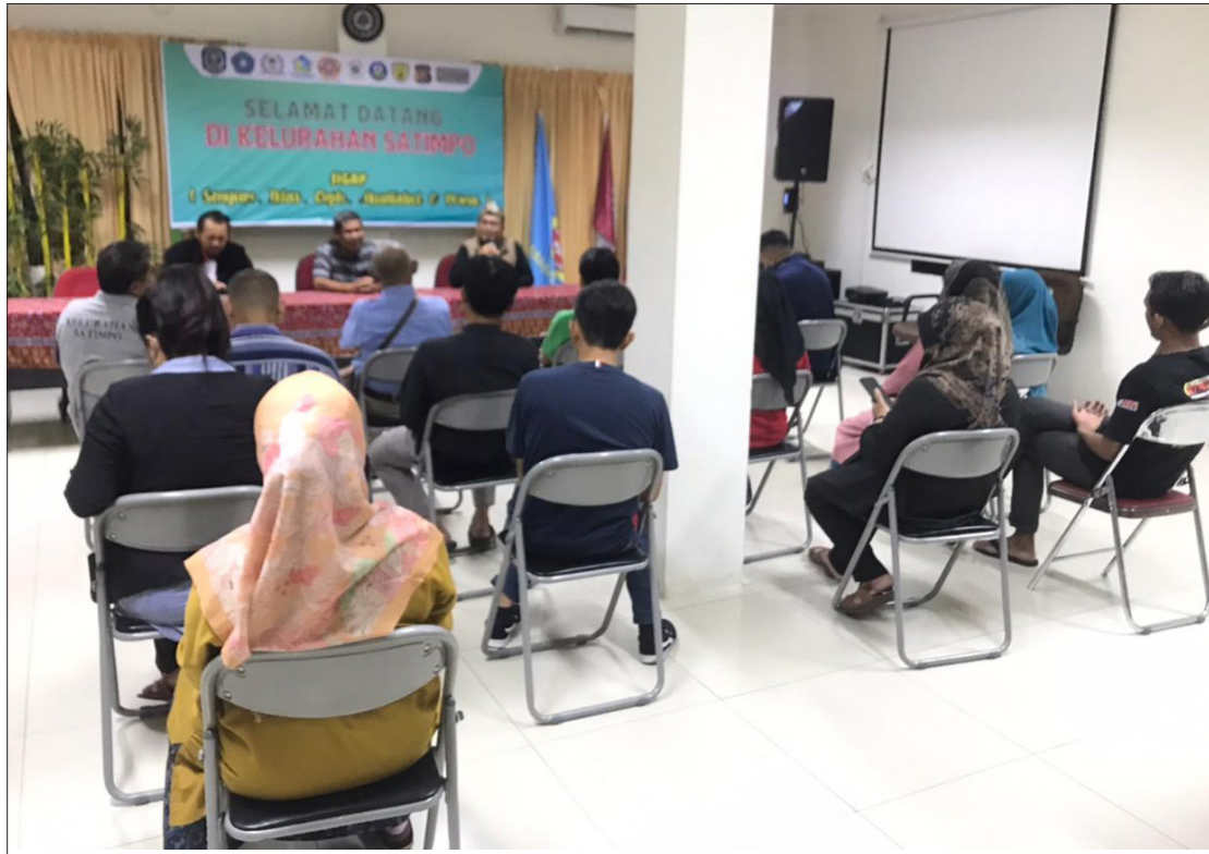
Pertemuan posyantek di Kelurahan Satimpo.