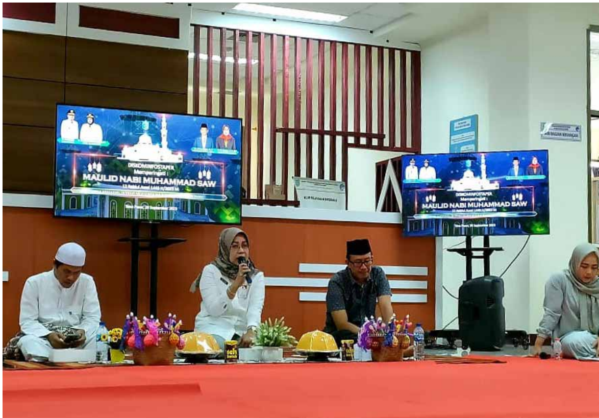
Pelaksanaan Maulid Nabi di Kantor DKISP Kabupaten Paser