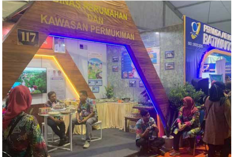
Suasana pembukaan Berau EXPO 2023.

kecamatan, untuk menampilkan 100 kampung yang ada di Bumi Batiwakkal. Sehingga, masyarakat juga dapat melihat kinerja Pemerintah Daerah lebih dekat," ujarnya.