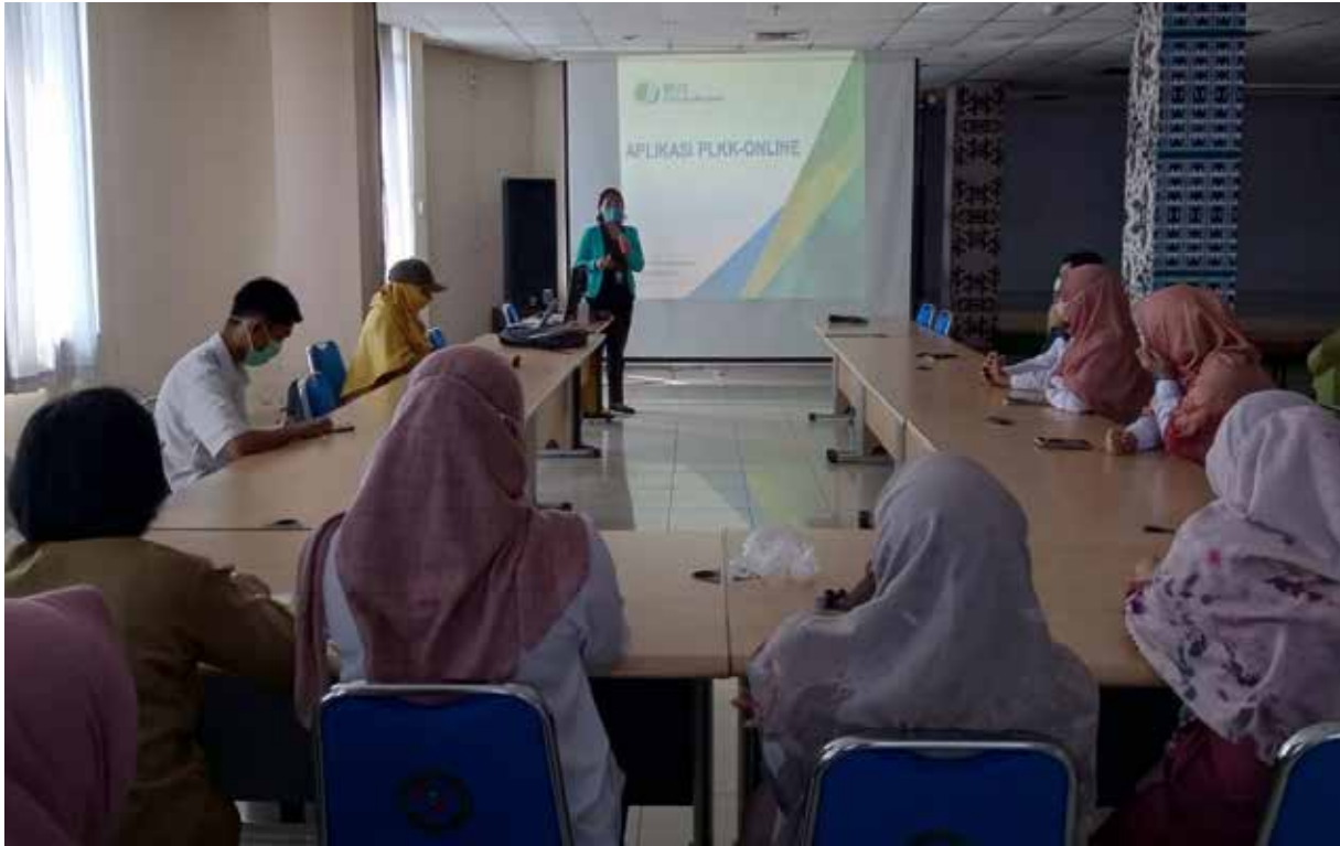
Pemaparan aplikasi online untuk PLKK di RSUD Taman Husada Bontang. (ist)