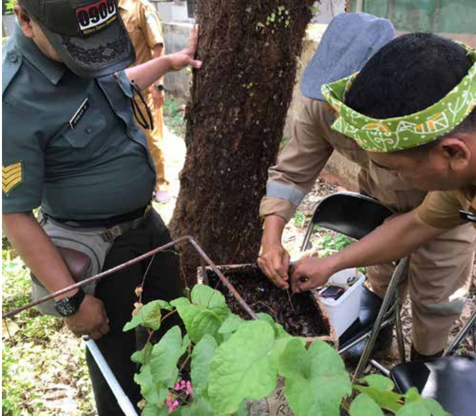
Foto: Panen perdana madu kelulut/klanceng di Kelurahan Satimpo.