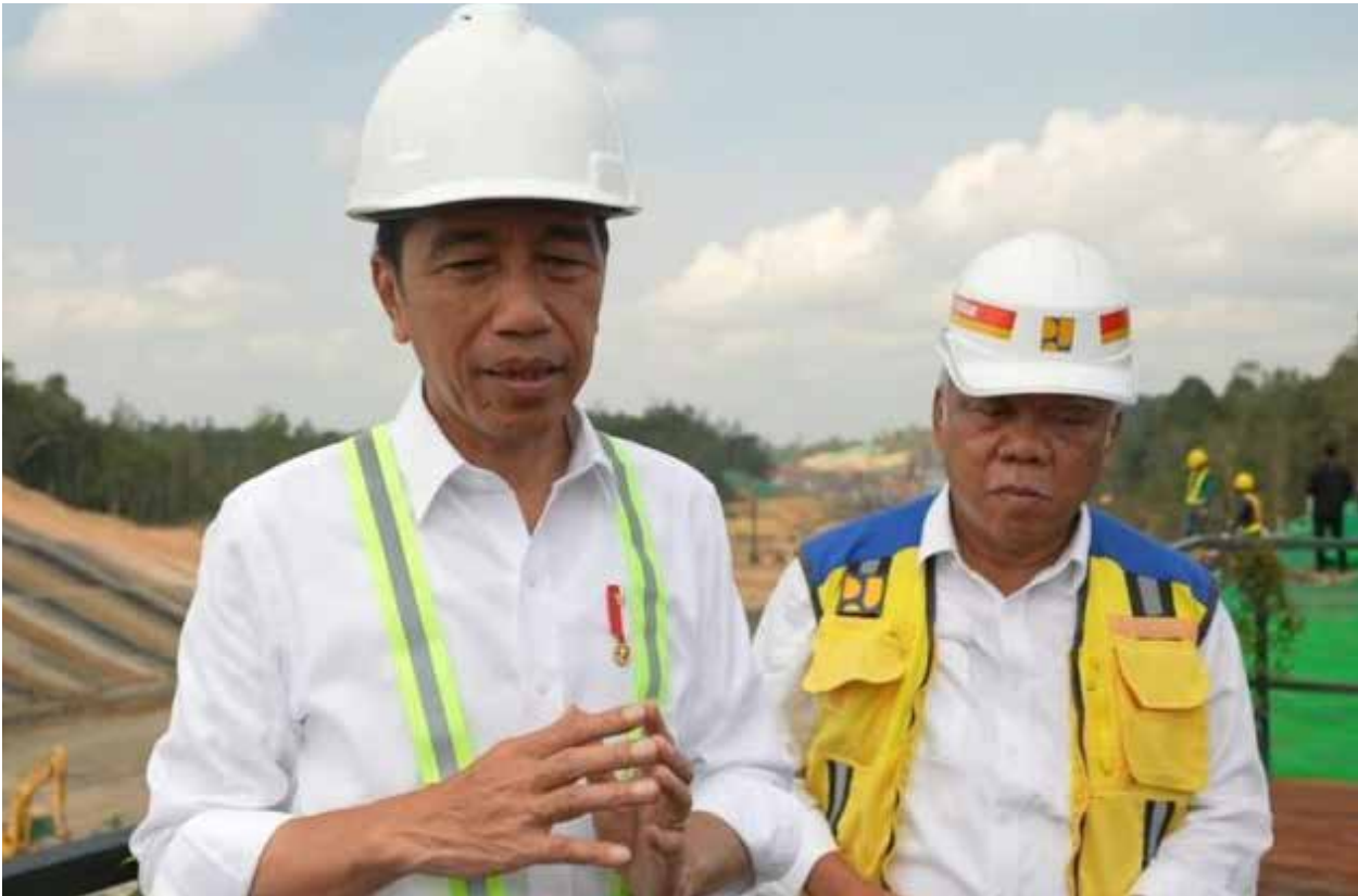
Presiden RI Joko Widodo meninjau proyek jalan tol di kawasan IKN, Kalimantan Timur, seperti disaksikan dalam video dari Jakarta, Rabu (1/11/2023).