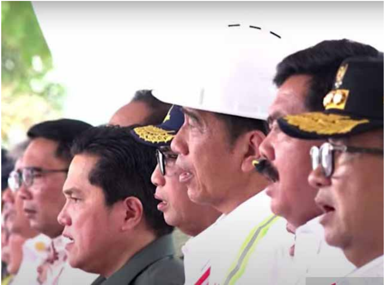
Presiden Joko Widodo (ketiga kanan) bersama para menteri Kabinet Indonesia Maju, kepala daerah, dan Mantan Gubernur Jawa Barat Ridwan Kamil saat “groundbreaking” pembangunan Bandara Ibu Kota Nusantara (IKN) di Penajam Paser Utara, Kalimantan Timur, Rabu (1/11/2023).