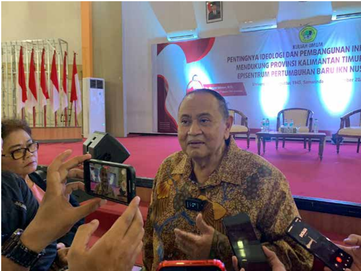
Politisi Emir Moeis saat hadir di Kuliah Umum di Untag Samarinda