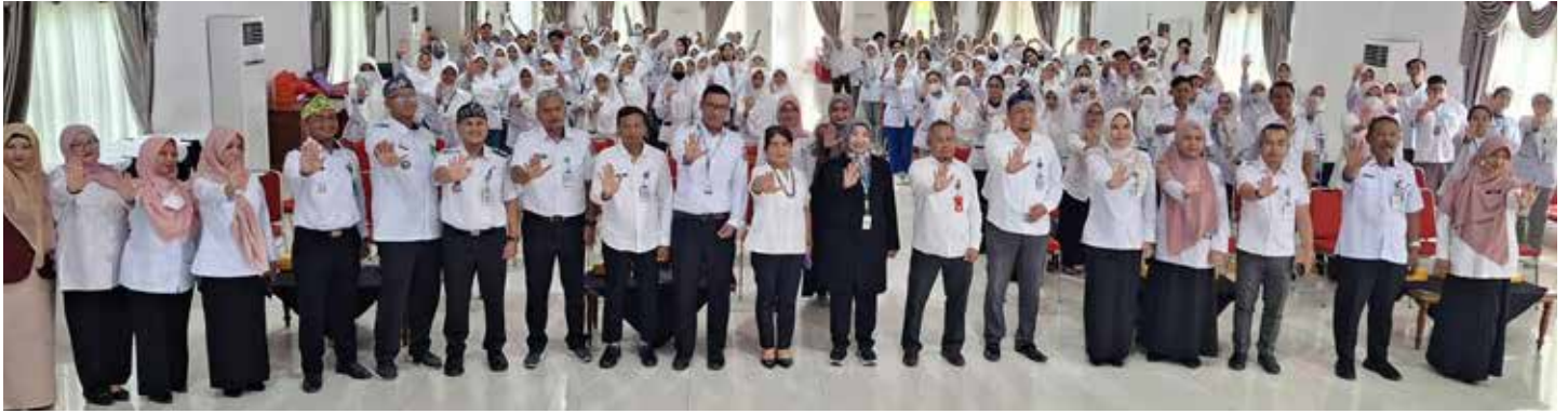
Foto bersama mahasiswa KKNT-IPE Poltekkes Kemenkes Kaltim bersama undangan yang hadir. (Yusva Alam)