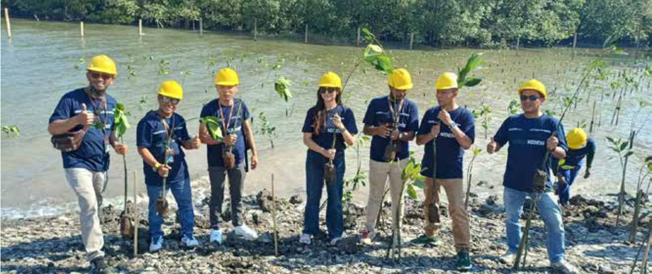
PT PNM Balikpapan dan PT Waskita Beton Precast Tbk. saat melakukan penanaman pohon mangrove.