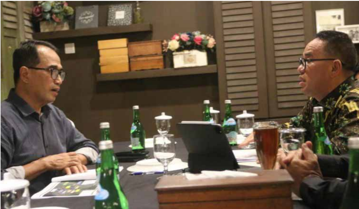
Pj Bupati PPU Makmur Marbun saat berdiskusi dengan Menhub Budi Karya Sumadi di Balikpapan, Selasa (31/10/2023).