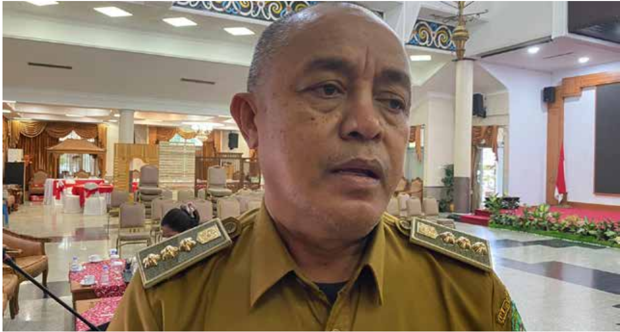
Camat Samboja, Damsik.