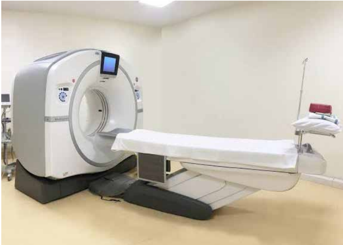
Ilustrasi alat medis CT Scan. (ist)