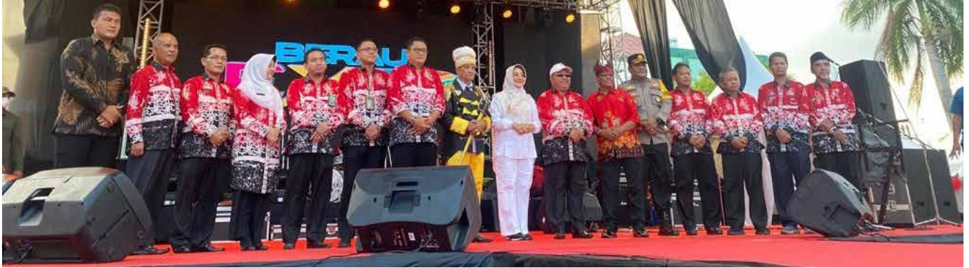
Foto: Suasana pembukaan Berau EXPO 2023.