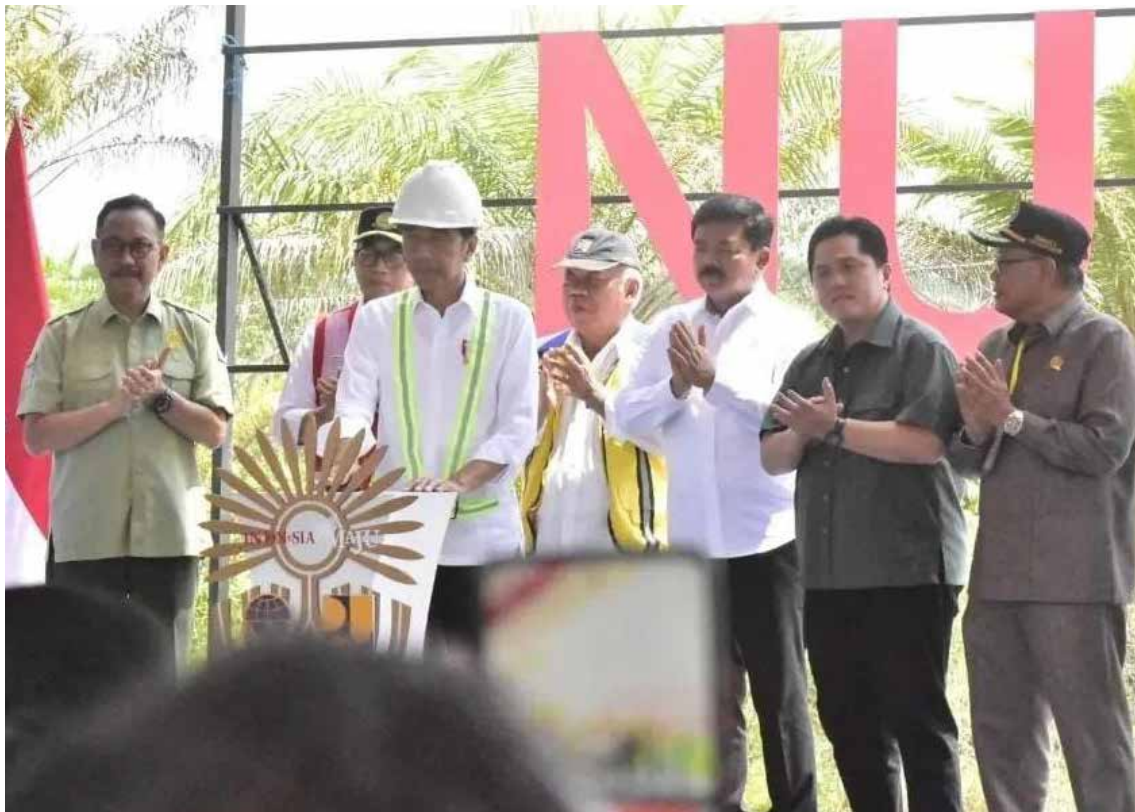
Groundbreaking Bandar Udara Ibu Kota Nusantara (IKN) di Kabupaten Penajam Paser Utara (PPU), Rabu (1/11/2023).