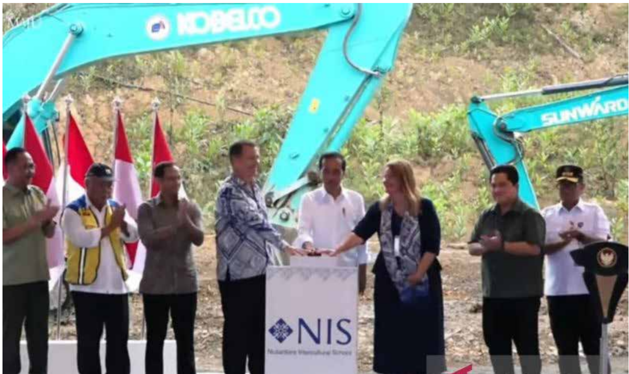
Presiden RI Joko Widodo meresmikan groundbreaking proyek sekolah internasional di kawasan IKN, Kalimantan Timur, seperti disaksikan dalam video dari Jakarta, Rabu (1/11/2023).