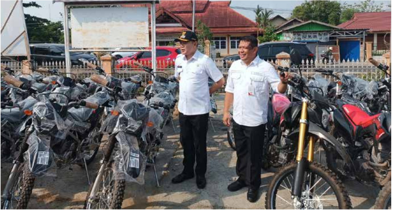
Pengecekan kendaraan roda dua sebelum diserahkan ke PPL