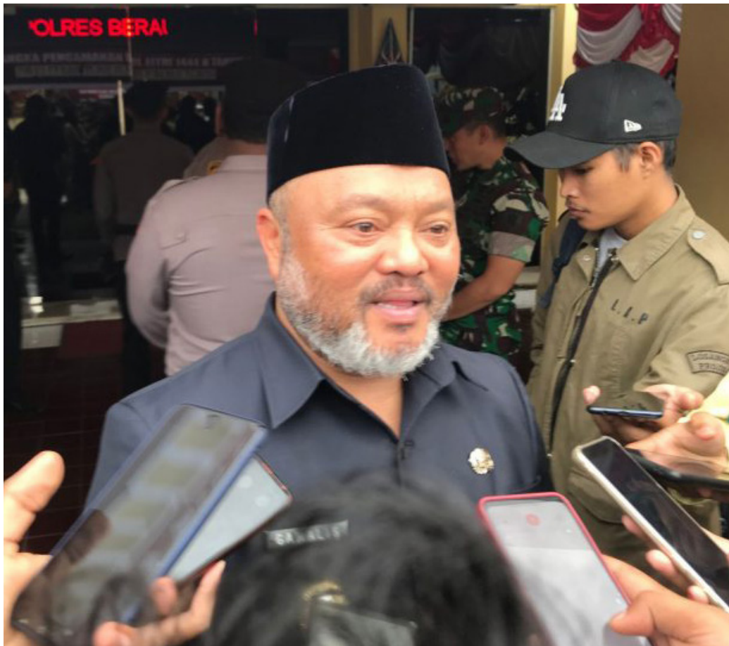
Wakil Bupati Berau, Gamalis.