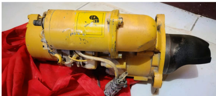
Barang bukti hasil pencurian