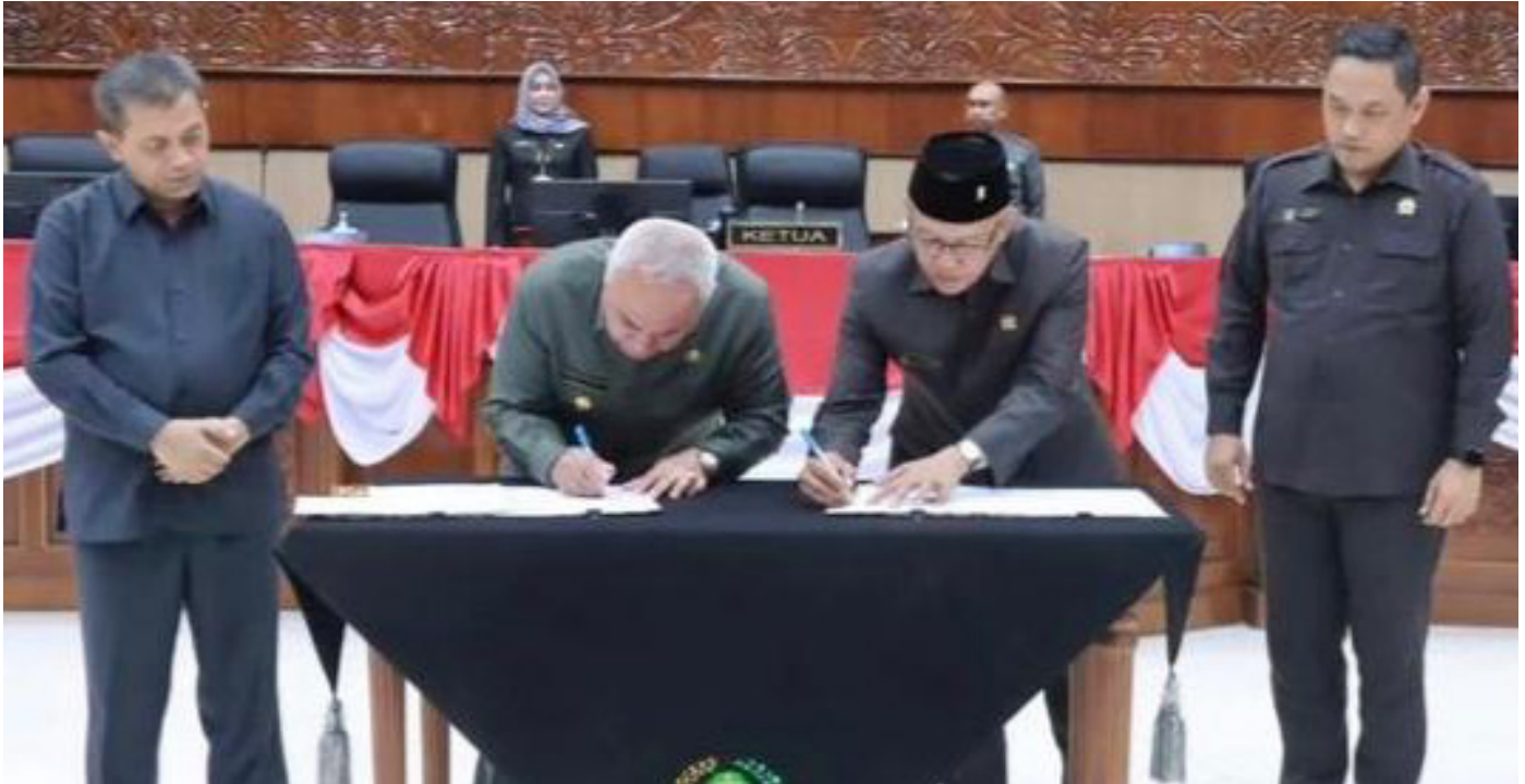
Prosesi penandatanganan kesepakatan APBD Kaltim 2024