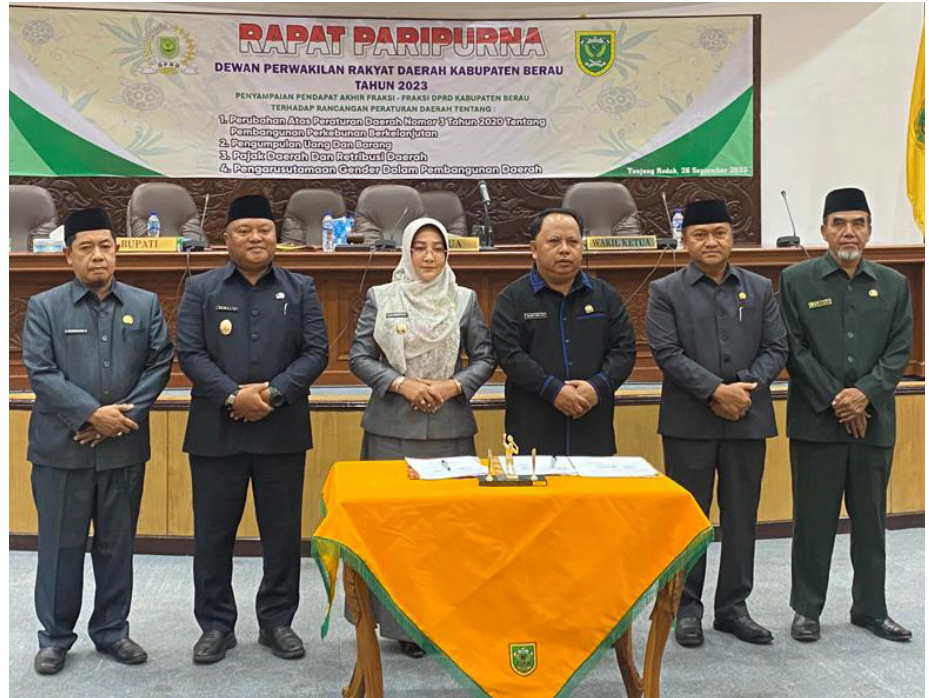
Rapat paripurna penyampaian pendapat akhir fraksi-fraksi guna mengesahkan empat Raperda jadi Perda.

"Semua masukan, saran, dan harapan dari anggota DPRD tentunya akan diadakan sebagai ref-