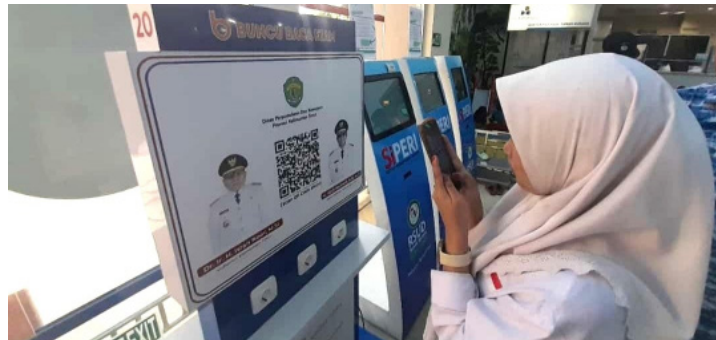
Salah seorang pelajar saat mencoba mesin Buncu Baca Etam