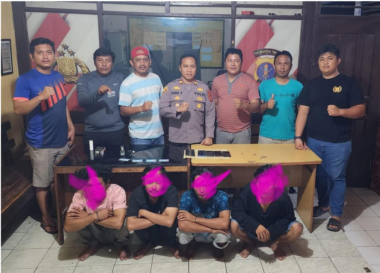
Petugas dan barang bukti serta para tersangka