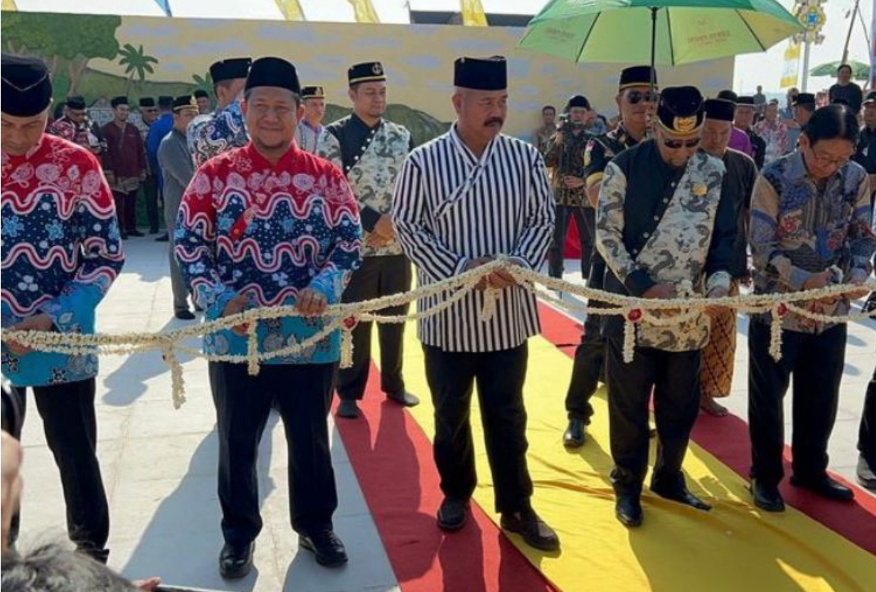
Suasana peresmian Taman Titik Nol Kesultanan, yang berada di hadapan Museum Mulawarman Tenggara.