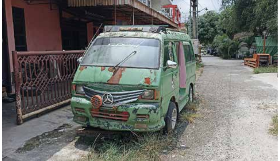
Angkutan Kota yang terbelongkang di sekitaran Terminal Sungai Kunjang (Ilust/Khoirul Umam/mediakaltim)

Yusuf bersama 2 orang lainnya merasa tidak puas dengan kepemimpinan Andi Harun. Sebab nasib mereka masih terlanjar, tidak jelas pendapatannya. Mereka tidak melihat Pemerintah Kota memedulikan penurunan pendapatan, sedangkan angkutan kota Samarinda sudah pernah mewarnai transportasi umum kota.