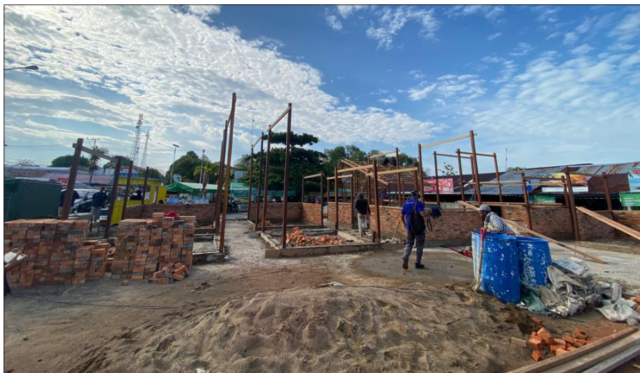
Pembangunan kios cindramata di halaman parkir Pelabuhan Sidayang Kampung Tanjung Batu Kecamatan Pulau Derawan.

Dijelaskannya, hal itu mengingat wilayah Derawan dan sekitarnya masuk dalam KSNP kategori pengembangan pariwisata baru. Adapun total dana sebenarnya sekitar Rp 15 miliar. Salah satunya untuk pembangunan kios cenderamata, kios kuliner dan penataan kawasan. Yang baru dibangun saat ini kios