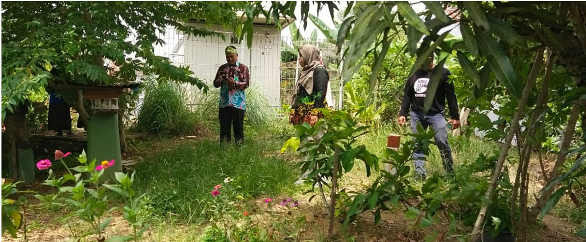
Penilaian lomba lingkungan hijau dan bersih di Kelurahan Satimo.