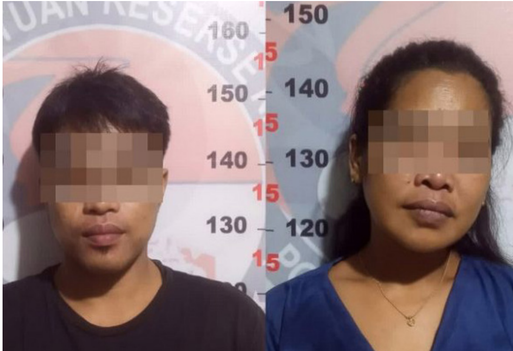
Sepasang suami istri kompak jual sabu.