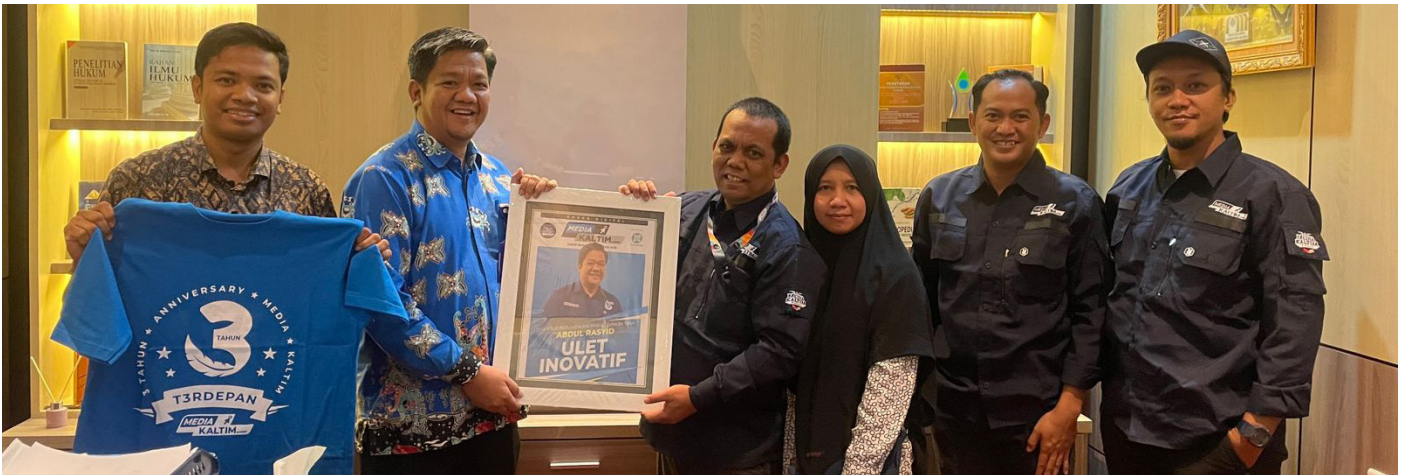
Momen pertemuan antara Manajemen Media Kaltim Grup dan PAM Danum Taka, Jumat (22/9/2023).