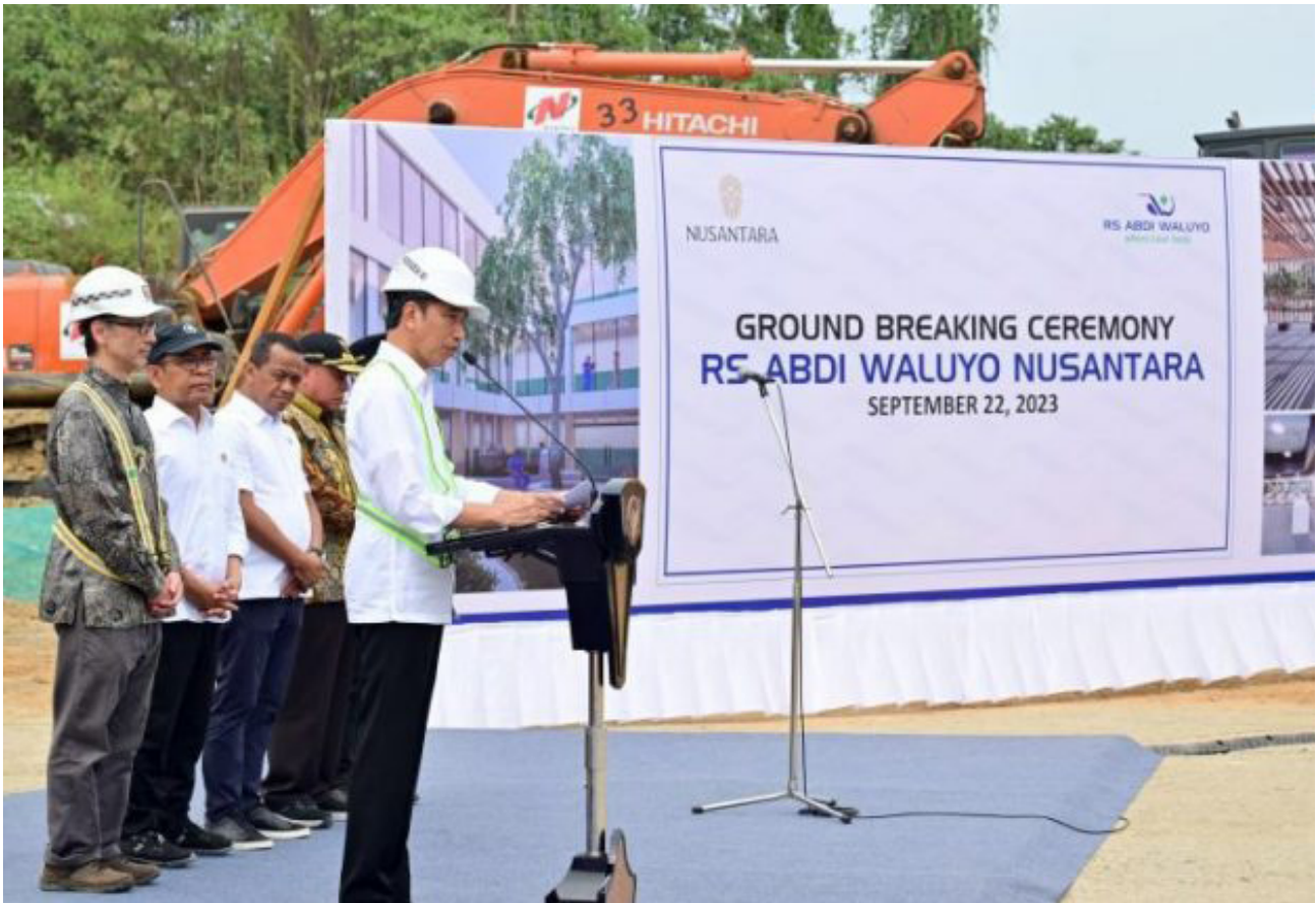
Presiden Joko Widodo dalam acara peletakan batu pertama Rumah Sakit Abdi Waluyo di kawasan Ibu Kota Nusantara, Kabupaten Penajam Paser Utara, Kalimantan Timur, Jumat (22/9/2023).