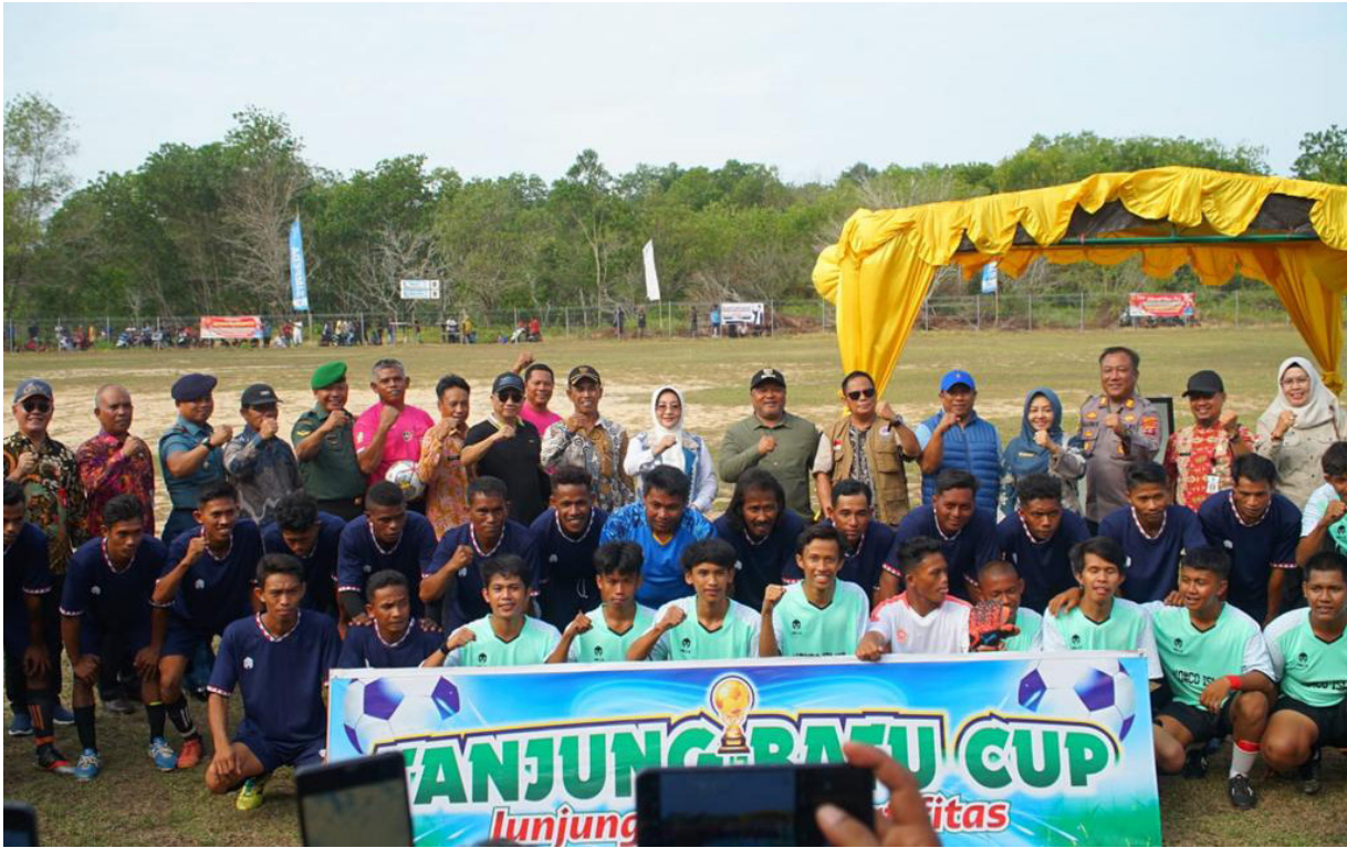
Pertandingan sepak bola Tanjung Batu Open tahun 2022.