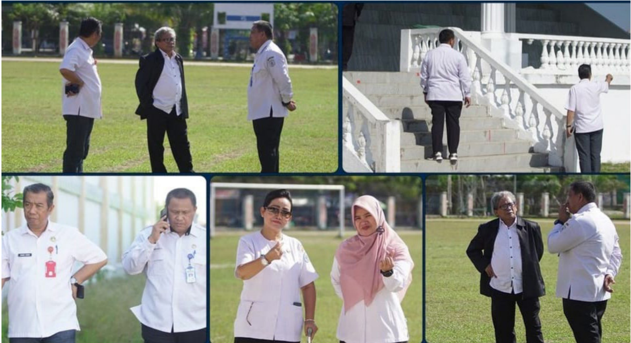
Aktivitas Dispopar Bontang meninjau Stadion Bessai Berinta sebelum direhab.