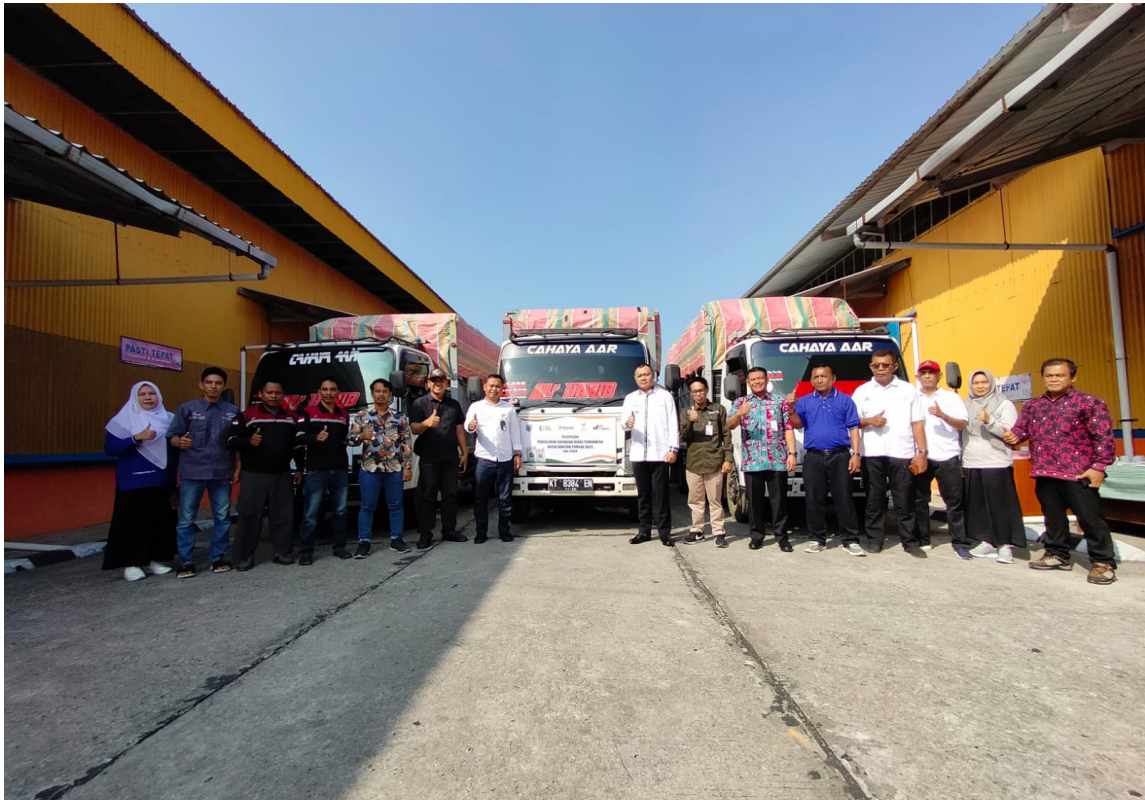
Pelepasan unit penyaluran bantuan pangan