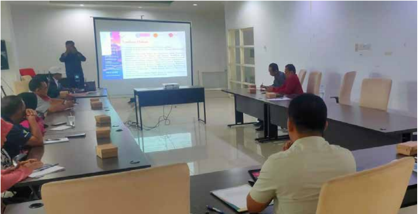
Persiapan lomba Desa Berprestasi di Kantor DPMD Kabupaten Paser