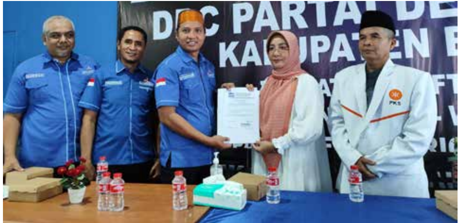
DPD PKS Berau serahkan Formulir ke DPC Demokrat di Kantor DPC Demokrat.

"Kami telah bersilaturahmi dengan Partai PPP, Hanura, Golkar, PKB dan Perindo. Namun, kami telah memiliki calon Bupati. Jika ada yang mengajukan Bakal Calon Wakil Bupati tidak