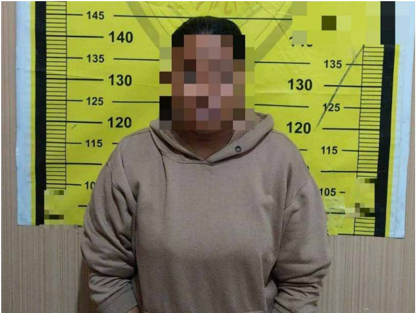
IRT berinisial YI (31) warga Tanjung Laut Indah, Bontang diamankan polisi.