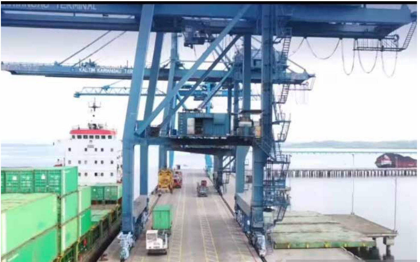
Pelabuhan kargo (peti kemas) di Kawasan Industri Kariangau (KIK) Balikpapan