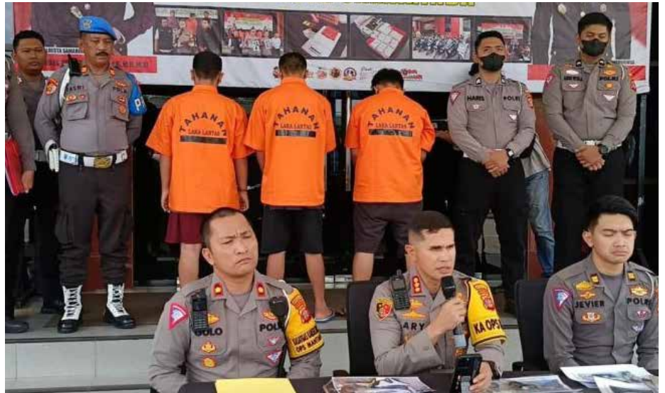
Kapolresta Samarinda Kombes Pol Ary Fadli beserta jajaran saat konferensi pers pengungkapan kasus, bertempat di Mapolresta Samarinda, Kaltim, Kamis (18/4).

kan tersangka pada dua kasus kecelakaan lalu lintas lainnya yang terjadi di wilayah hukumnya. Selain kasus kecelakaan di Tol Samarinda-Balikpapan, dua tersangka lain juga ditetapkan terkait insiden di Jalan Poros Samarinda-Bontang dan Jalan MT Haryono Samarinda.