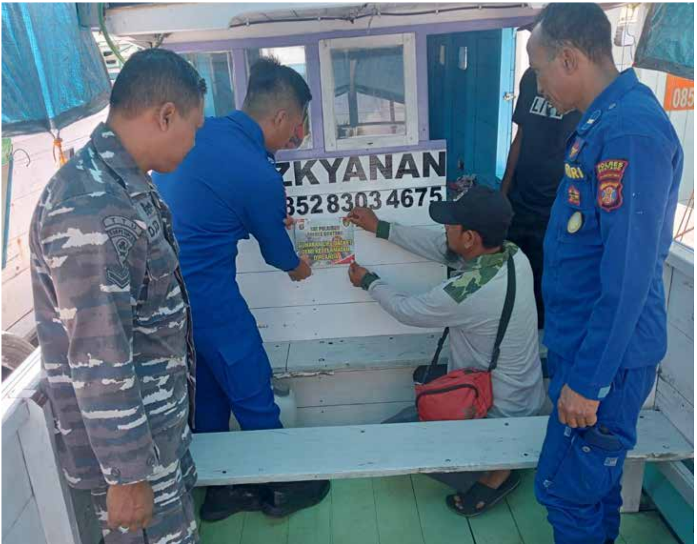
Polairud Bontang lakukan sosialisasi di Pelabuhan Tanjung Laut Indah, Bontang (Dok).