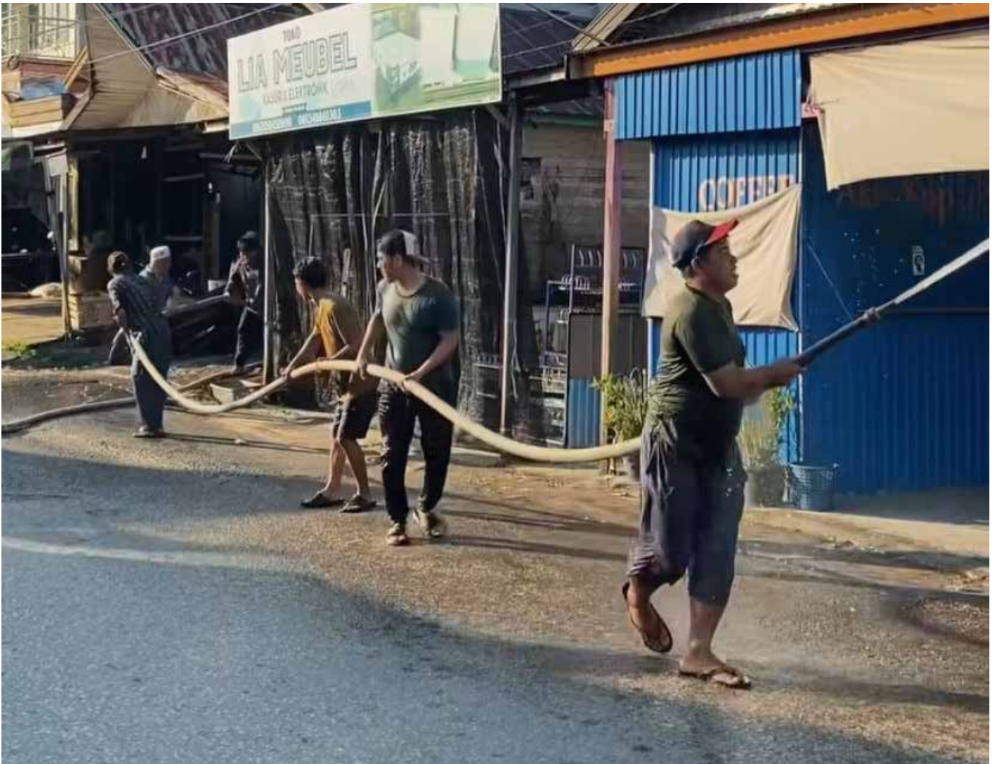
Suasana penyiraman rumah warga di Desa Kota Bangun Ulu