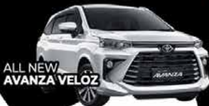
ALL NEW AVANZA VELOZ