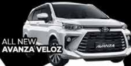
ALL NEW AVANZA VELOZ