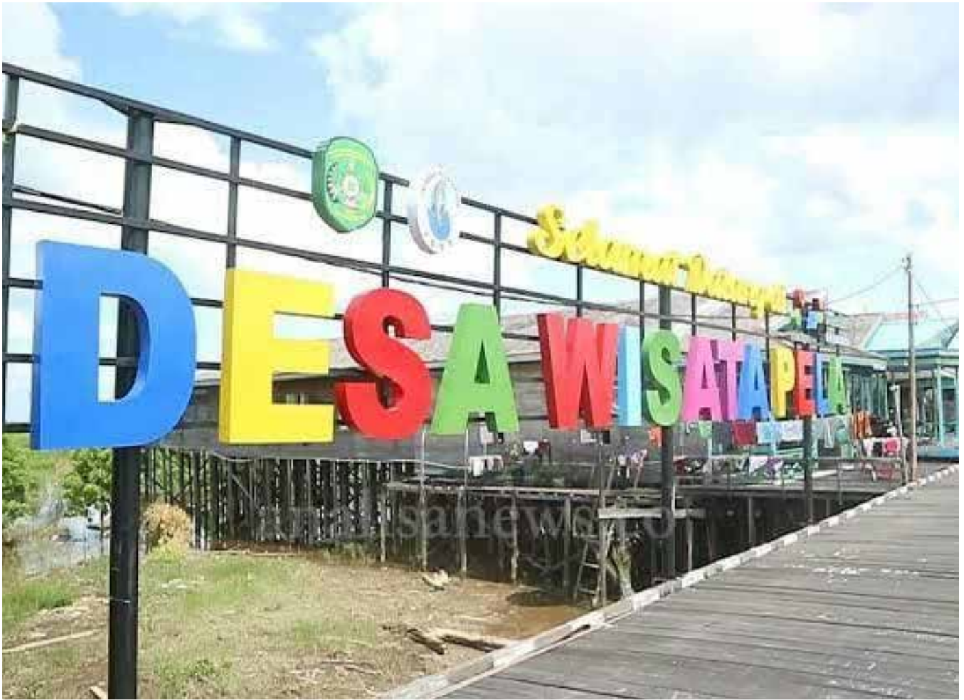
Panorama Desa Wisata Pela, Kecamatan Kota Bangun. (Istimewa)