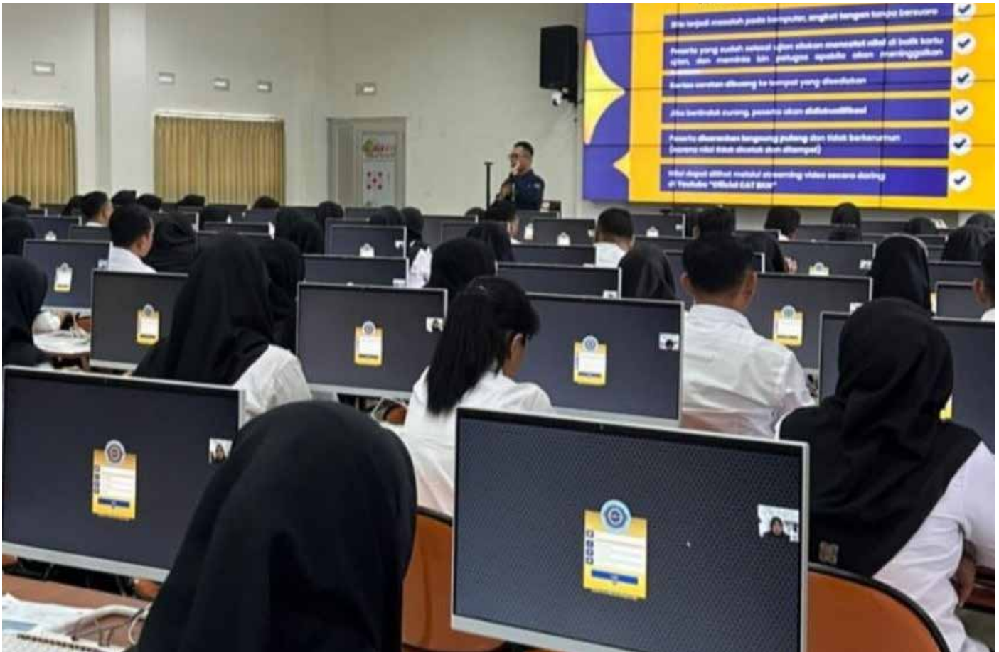
Suasana tes SKD PPPK 2023.