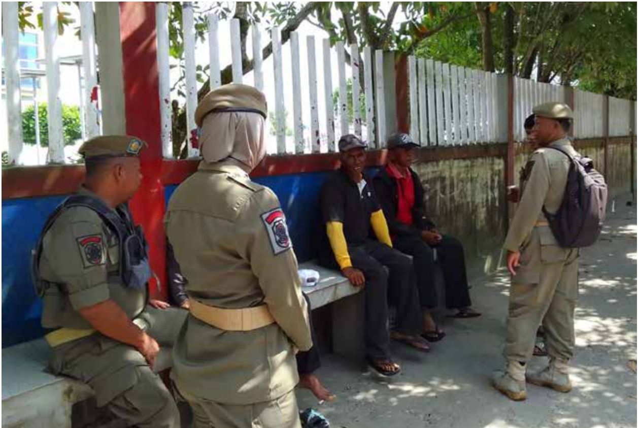
Personel Satpol PP PPU saat melakukan pengamanan di kawasan Pelabuhan Penajam.