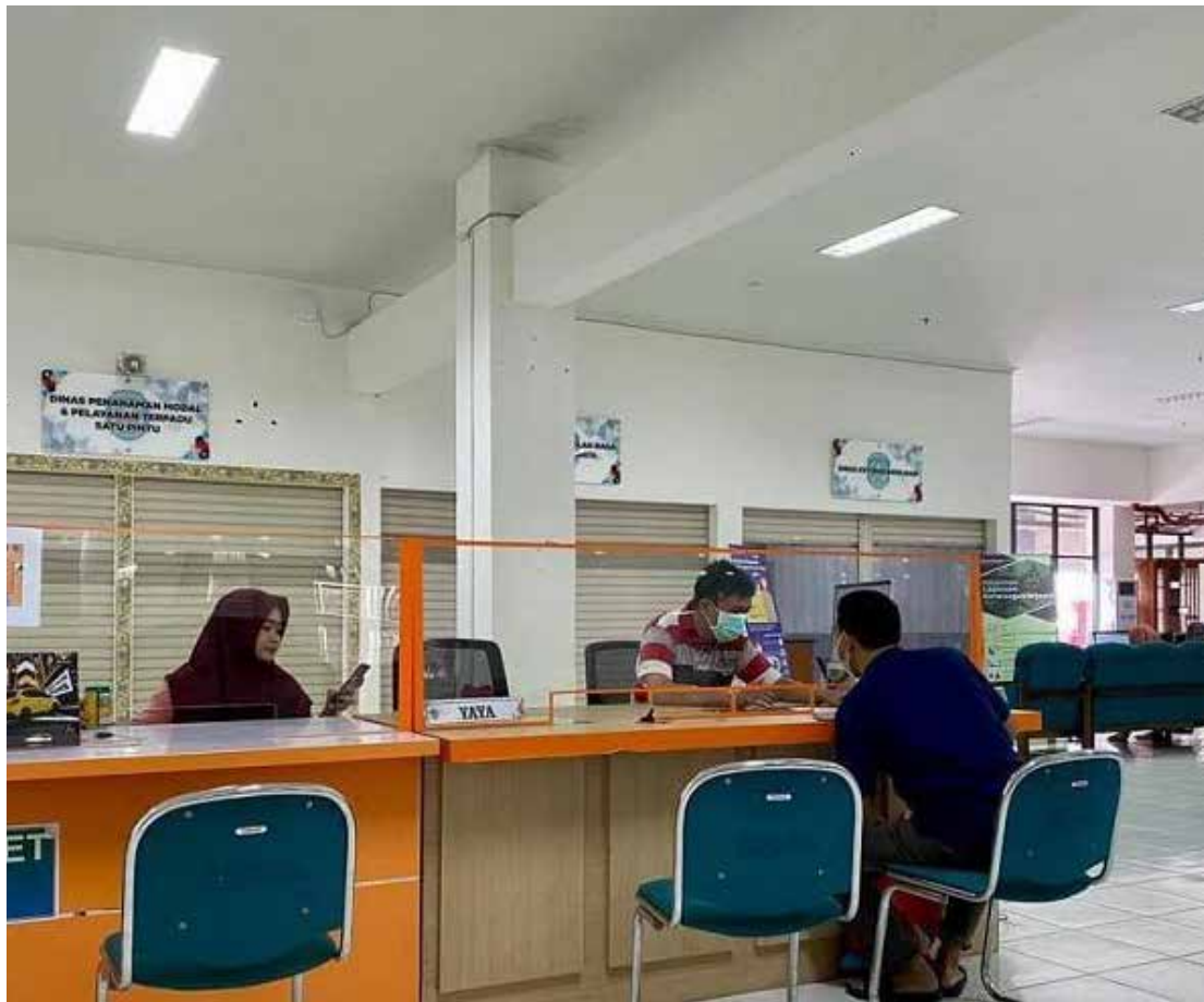
Pelayanan di MPP Bontang. (ist)