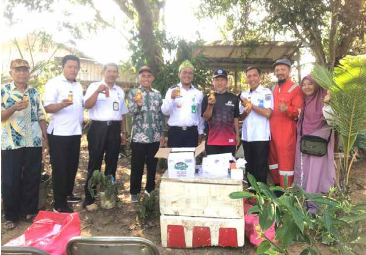
Kegiatan penghijauan pekarangan dan ternak lebah.