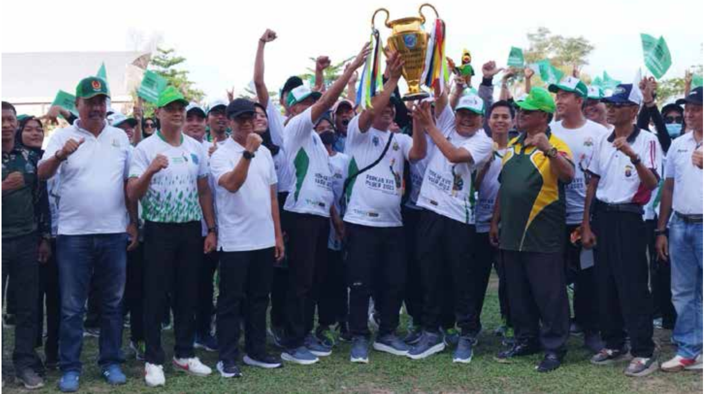
Penutupan Porkab ke 17 Paser