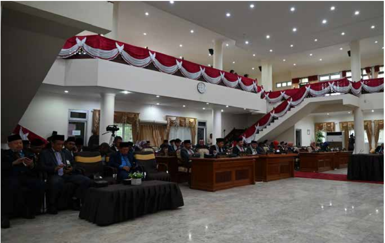
Rapat paripurna di Gedung Baling Seleloi