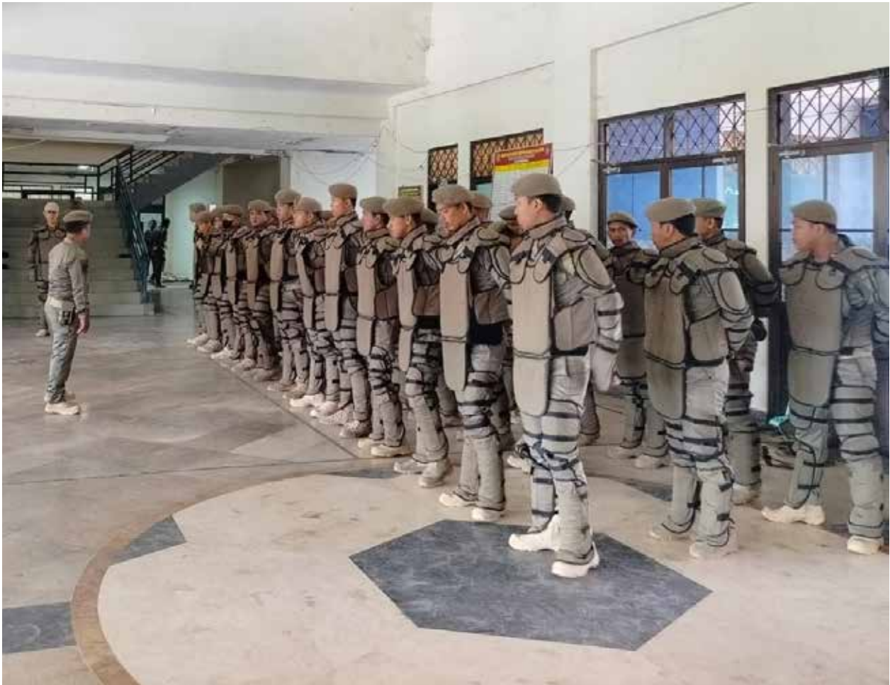
Apel personel Satpol PP PPU.