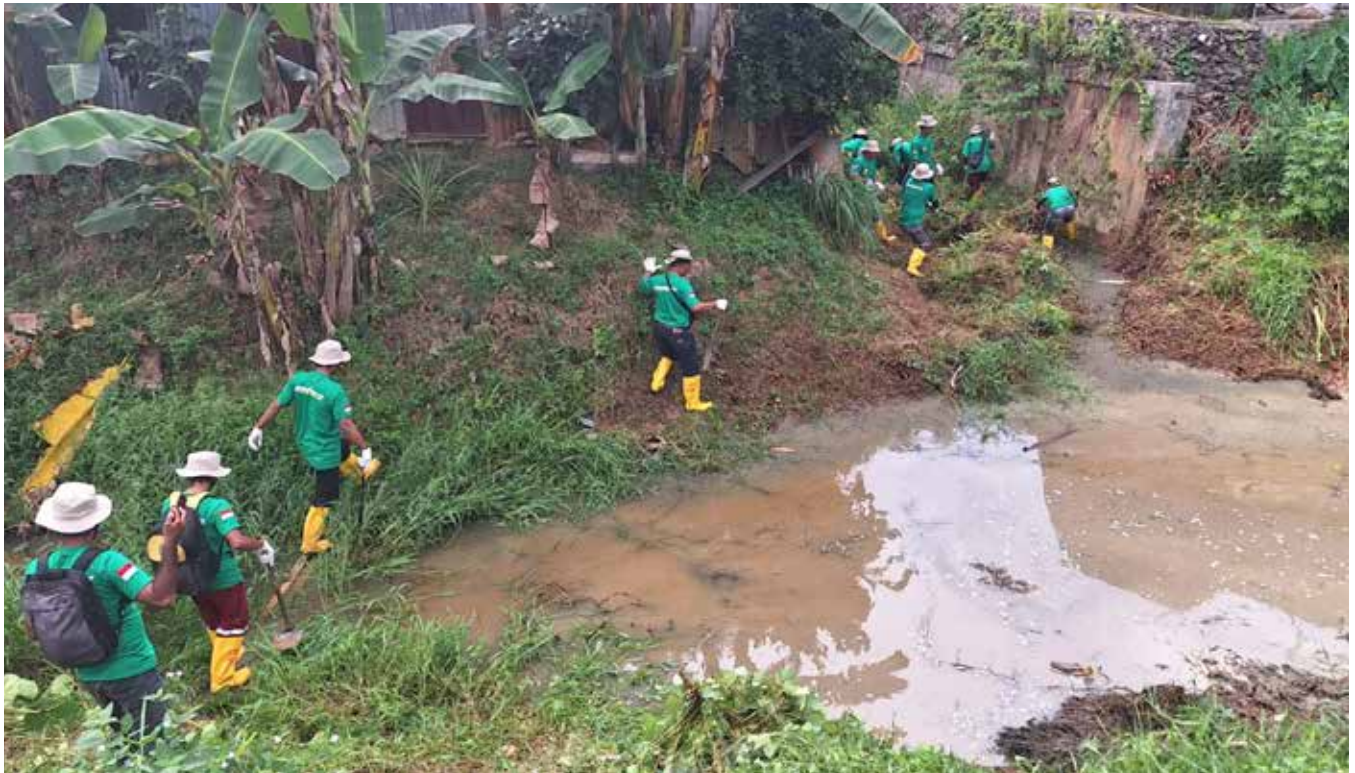
PHL di Dinas PUPRK saat mengerjakan normalisasi sungai beberapa waktu lalu. (Yusva Alam)