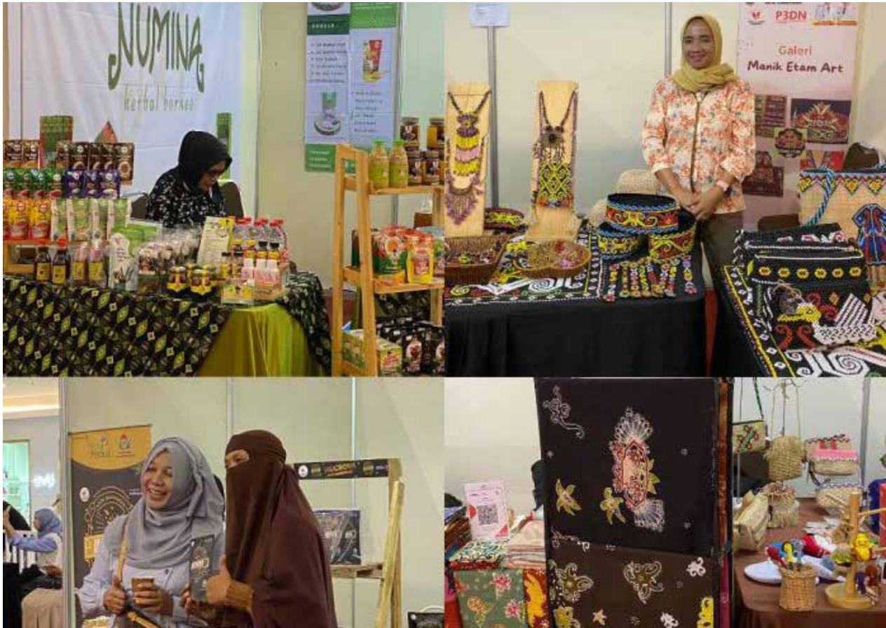
Expo UMKM Gadepreneur di Pekan Raya Pegadaian