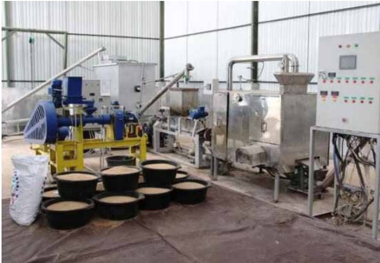
Ilustrasi pabrik pakan ikan