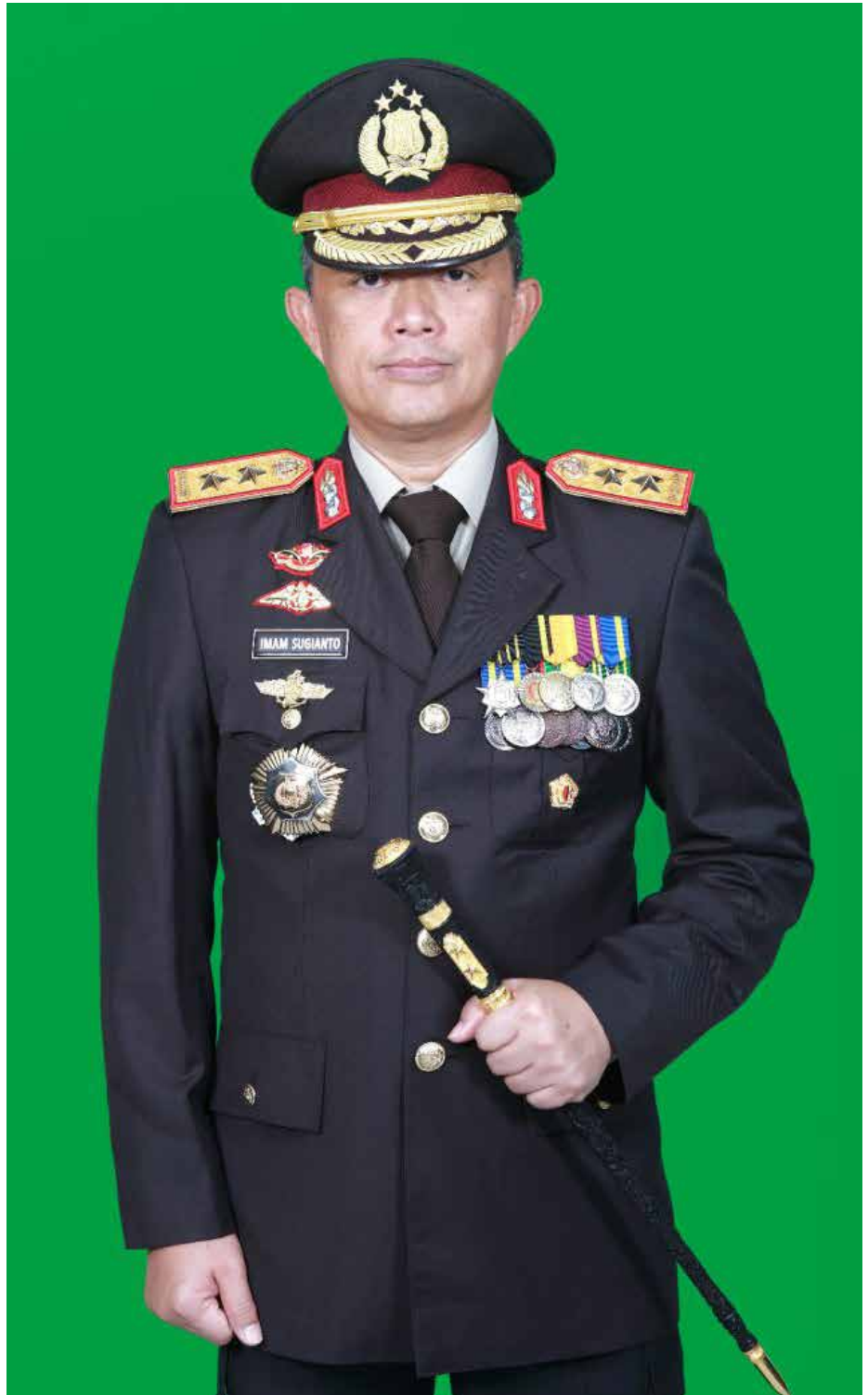
Kapolda Kaltim, Irjen Imam Sugianto yang akan mutasi menjadi Kapolda Jawa Timur.