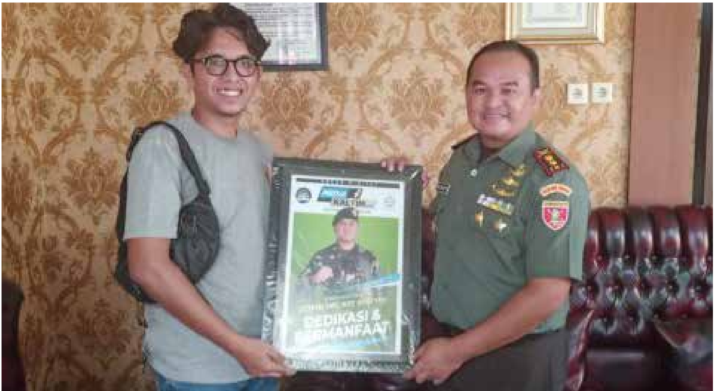
Berbalas cinderamata bersama Dandim 0904/PSR