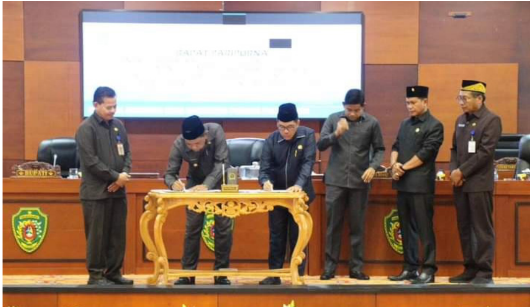
Penandatanganan nota kesepakatan KUA-PPAS APBD Perubahan 2023 dan APBD 2024 PPU, Sabtu (12/8/2023)