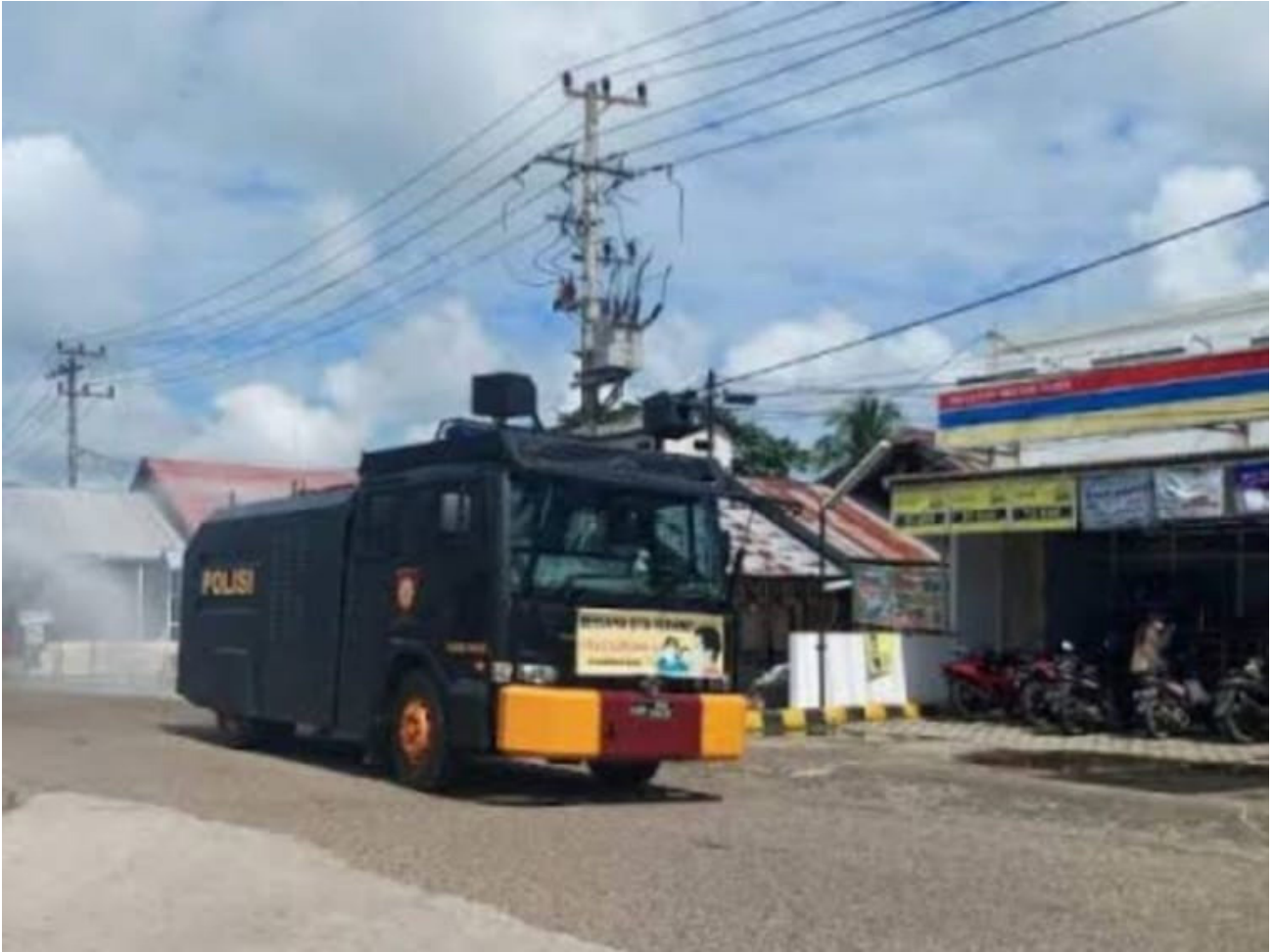
Unit water canon milik Polres Paser