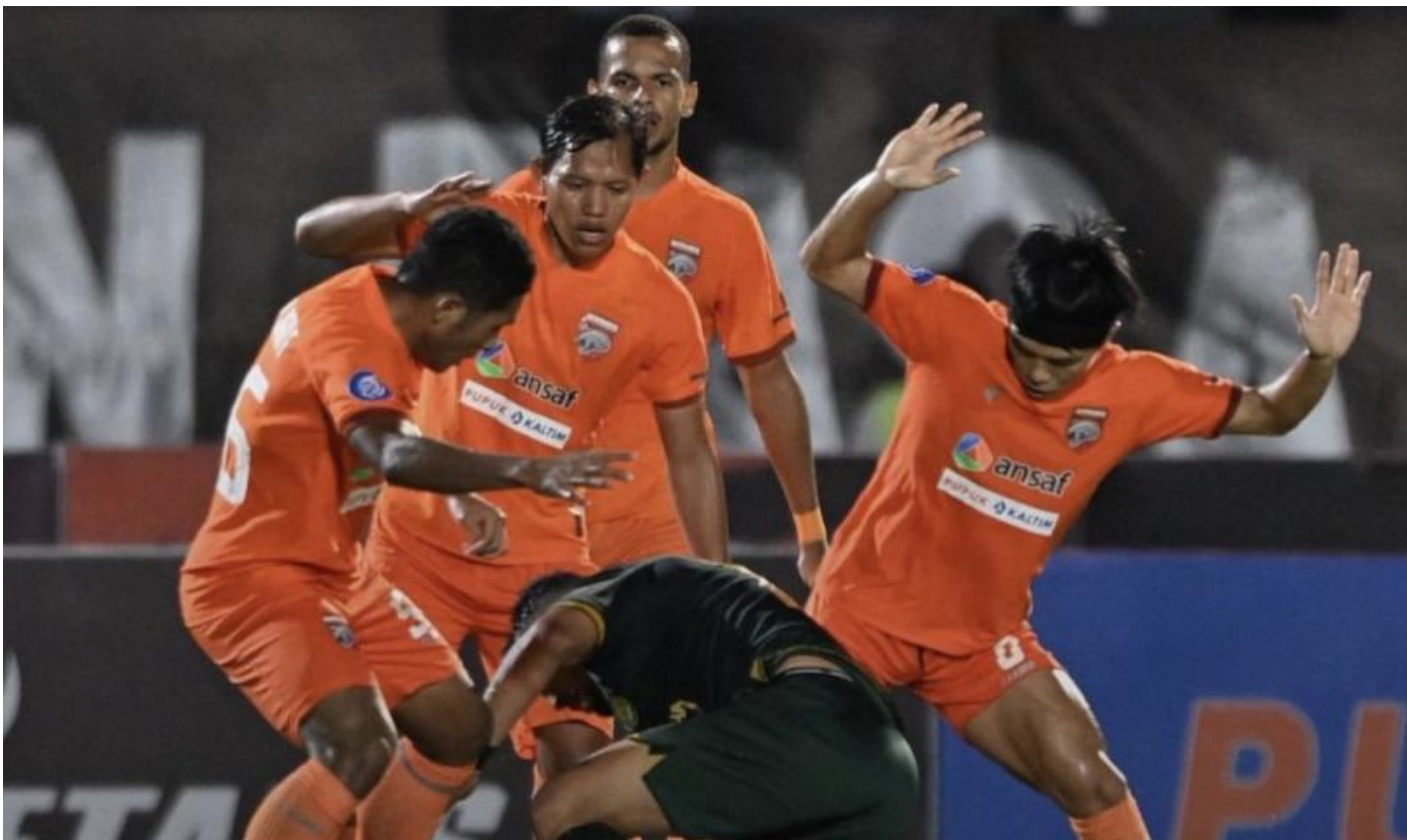
Pemain periskabo mendapat hadangan tiga oemain Borneo FC pada lanjutan Liga 1 2013 di Stadion Segiri Samarinda.