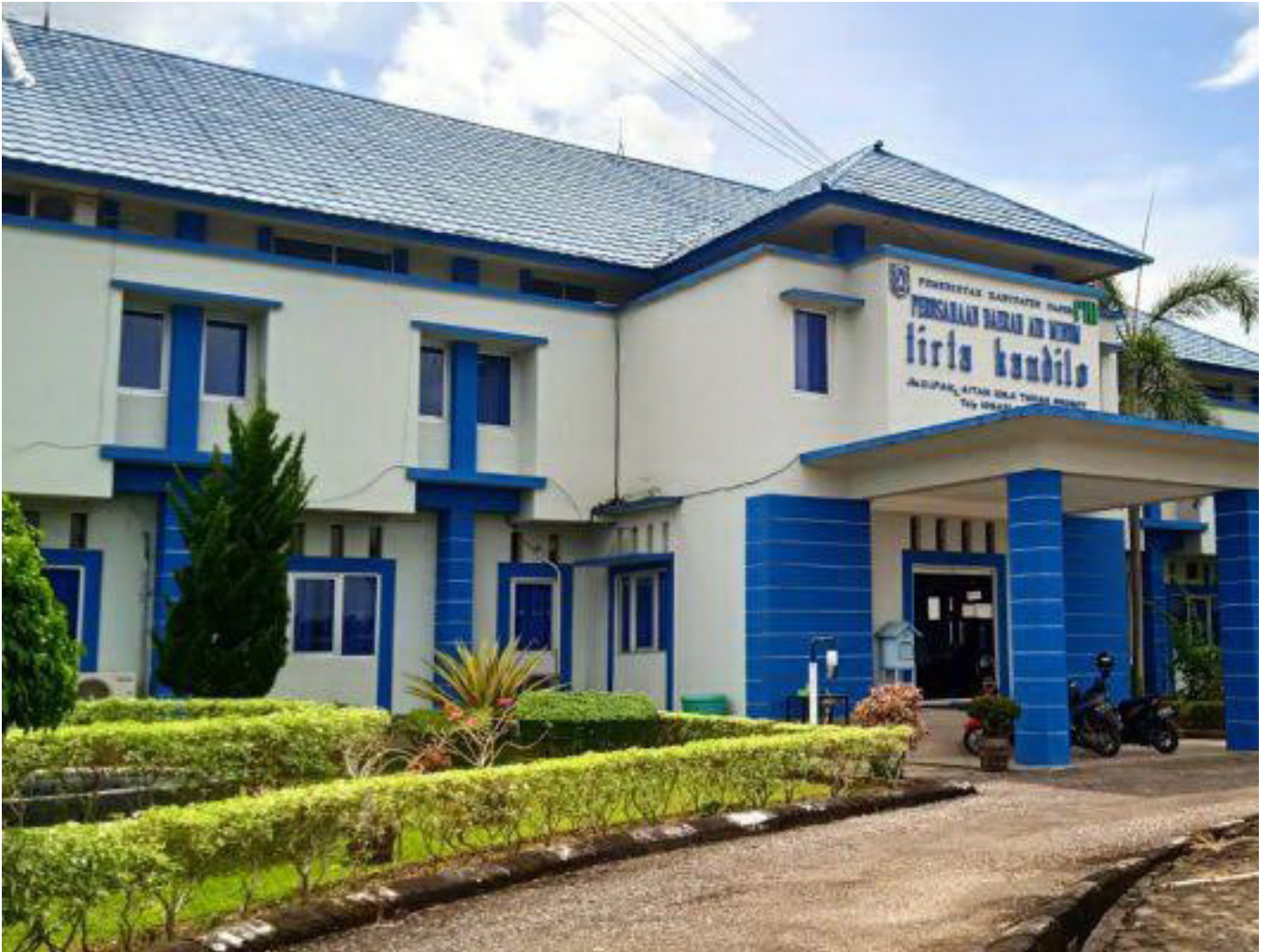
Kantor Perumda Air Minum Tirta Kandilo