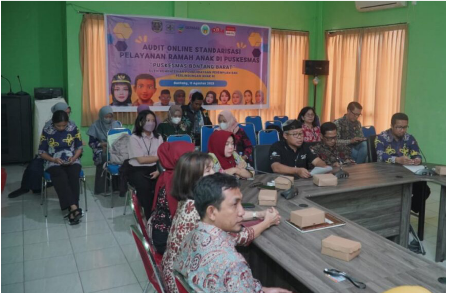
Audit pelayanan ramah anak di Puskesmas Bontang Barat.